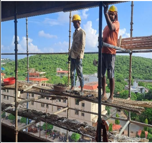
(3) वन बिजनेस सेंटर, ग्वालियर में ऊंचे भवन निर्माण में बिना सुरक्षा जाल के एवं सेफ्टी बेल्ट पहने कार्य करते हुए कर्मकार