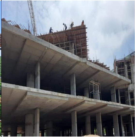
(4) लैंडमार्क, इंदौर में ऊंचे भवन के निर्माण में बिना सुरक्षा जाल के एवं सेफ्टी बेल्ट पहने कार्य करते हुए कर्मकार