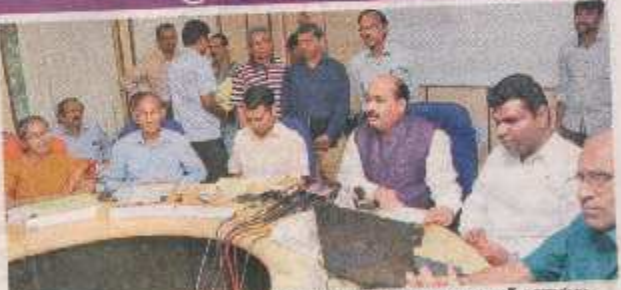
గురువారం ఇకొంటెంట్ జనకల్ (పల్) ఇష్టుమరో మీడియాతో మాల్లారుతున్న కాగ్ అభికారులు

ప్రావరాలన్, మార్చి 211 ఎందగాల ప్రభుత్వం ఆర్థిక క్రమాశ్వల జిహ్హందర్ బారత సంస్థాలక్ ఆట కడ జనరల్ (కాగ్) ఇక్టుతలు వేసింది. కానునింధ ండైల్ సమావేగాల ముగియి రోజుక గురువారం සිස්ස් 'හම්' මර සිස්සරය සිස්ලාස්සේ නයක්ව යුතුන්ගත පතු යුතු<del>න්නුගිම් මේම</del> පුරාම්සුක වීමට හරි ක්වායවූමේ අදුම රාජ් 6 00 2018-170° 0 60 50 1388 50 comy tenses when between below অসমত প্রত্য প্রত্যাপ্ত স্থানিকা কা more bling about 6-8,778 Ifto and the entoute of agenture రూ.15281 (n.48శారం) మానుచిందని, ఆయితే మొక్కం రూ.1500 కోట్ల మనహాయించిన తర్వాత నాగ్ పేర్కాంటి. ఆదురు రాష్ట్రం ఇప్పరా తెచ్చుకున్న విములు చేసున్నా జీమ్మోమీలో ద్రవ్యలోకు మృక్తి శనిశాతంగా కోట్ల కాండ్ల ర్వారా