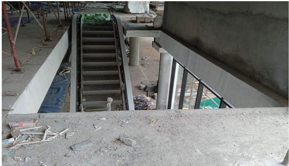
ചിത്രം 5.3 : മെസ്റ്റേഴ്സ് കല്യാൺ സിൽക്സ് കെട്ടിടം, തൊണ്ടയാട് ജംഗ്ഷൻ, കോഴിക്കോട്. ഒരു കെട്ടിട നിർമ്മാണ തൊഴിലാളിയോ, വാഹനമോ അല്ലെങ്കിൽ ലിഫ്റ്റിംഗ് ഉപകരണമോ വീഴാൻ സാധ്യതയുള്ള എല്ലാ തുറന്ന വശങ്ങളും ശരിയായി അടയ്ക്കുന്നതിലും സംരക്ഷിക്കുന്നതിലും ഉണ്ടായ വീഴ്ച. 2023 സെപ്റ്റംബർ 20-ന് ഓഡിറ്റ് പാർട്ടി എടുത്ത ചിത്രം.

2021 സെപ്റ്റംബർ 26-ന് കോൺക്രീറ്റ് സ്റ്റാമ്പുകൾ ഇടിഞ്ഞു വീണ് രണ്ട് അതിഥി തൊഴിലാളികൾ മരണപ്പെടുകയും മൂന്ന് അതിഥി തൊഴിലാളികൾക്ക് ഗുരുതരമായി പരിക്കേൽക്കുകയുമുണ്ടായി. നിർമ്മാണം ആരംഭിച്ച രണ്ട് വർഷം പിന്നിട്ടെങ്കിലും അപകടം നടന്ന തൊട്ടടുത്ത ദിവസം മാത്രമാണ് വകുപ്പിന്റെ നേതൃത്വത്തിൽ പരിശോധന നടത്തിയത്. പട്ടിക 5.7-ൽ വിശദമാക്കിയിരിക്കുന്നതു പോലെ, ഓരോ മാസവും 10 പരിശോധനകൾ നടത്തണമെന്നുള്ള സർക്കാർ വിജ്ഞാപനത്തിന്റെ (2015 മേയ്) ലംഘനമാണിത്. കൂടാതെ, നിയമത്തിൽ അനുശാസിക്കുന്ന സുരക്ഷാ നടപടികൾ പാലിക്കുന്നതുമായി ബന്ധപ്പെട്ട് 14 നിയമലംഘനങ്ങളും പരിശോധനയിൽ കണ്ടെത്തി. രണ്ട് വർഷത്തിന് ശേഷം, 2023 സെപ്റ്റംബർ 20-ന് വകുപ്പിലെ ഓഫീസർമാരുമായി ചേർന്ന് മേൽപ്പറഞ്ഞ സ്ഥലത്ത് ഓഡിറ്റ് സംയുക്ത ഭൗതിക പരിശോധന നടത്തുകയും, അപകടത്തെ തുടർന്ന് 2021 സെപ്റ്റംബറിൽ തൊഴിൽ വകുപ്പ് ചൂണ്ടിക്കാണിച്ച നാല് സുരക്ഷാ ലംഘനങ്ങൾ രണ്ട് വർഷം പിന്നിട്ടിട്ടും സ്ഥാപനം പരിഹരിച്ചിട്ടില്ലെന്നു കണ്ടെത്തുകയും ചെയ്തു.