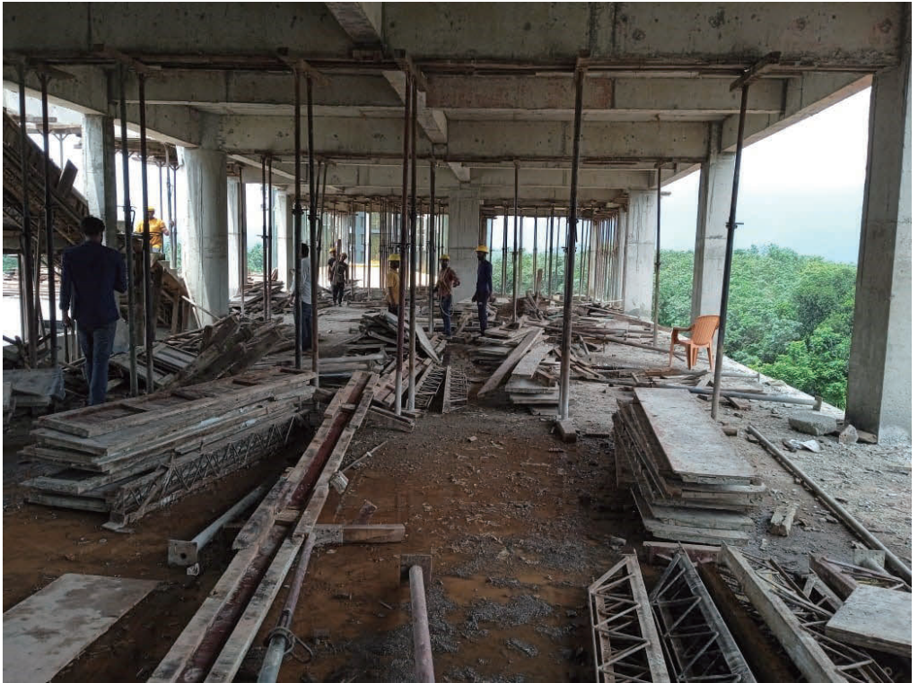
ചിത്രം 5.5: ഹിൽസിനായി കെട്ടിടം, മർകസ് നോളഡ്ജ് സിറ്റി, കൈതപ്പൊയിൽ, കോഴിക്കോട്. സ്റ്റോപ്പ് മെമ്മോ പുറപ്പെടുവിച്ചതിനു ശേഷവും നിർമ്മാണസ്ഥലത്ത് പ്രവർത്തനം തുടരുന്നു. ഓഡിറ്റ് പാർട്ടി 2023 സെപ്റ്റംബർ 21-ന് എടുത്ത ചിത്രം.