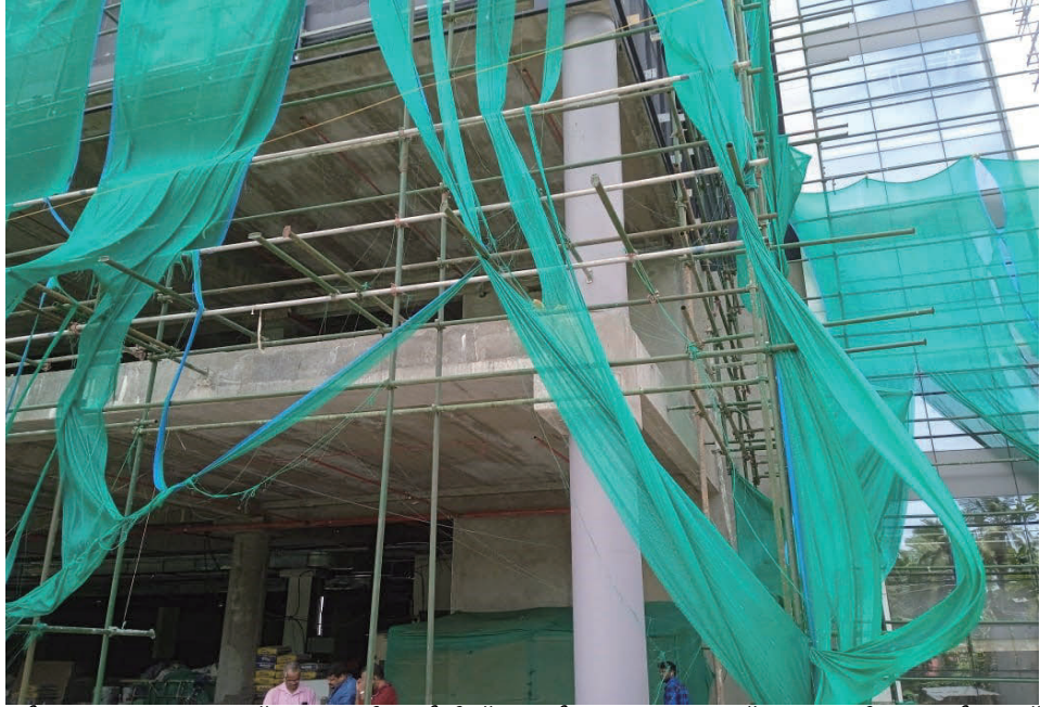
ചിത്രം 5.4 : മെസ്സേജ് കല്യാൺ സിൽക്ക് കെട്ടിടം, തൊണ്ടയാട് ജംഗഷൻ, കോഴിക്കോട്. അപകടങ്ങൾ തടയാൻ ഗുണനിലവാരമുള്ള സുരക്ഷാ വലകൾ ഉപയോഗിക്കുന്നതിൽ വരുത്തിയ വീഴ്ച, 2023 സെപ്റ്റംബർ 20-ന് ഓഡിറ്റ് പാർട്ടി എടുത്ത ചിത്രം.

ഭാവിയിൽ ഇത്തരം സംഭവങ്ങൾ ഉണ്ടാകാതിരിക്കാൻ നിയമങ്ങളിൽ/ചട്ടങ്ങളിൽ പറഞ്ഞിരിക്കുന്ന ത്വരിത നടപടികളിലൂടെ സുരക്ഷാ മാനദണ്ഡങ്ങൾ നടപ്പിലാക്കുന്നതിലുള്ള സർക്കാരിന്റെ അശ്രദ്ധമായ സമീപനത്തിലേക്കാണ് ഇത് വ്യക്തമായി വിരൽ ചൂണ്ടുന്നത്.