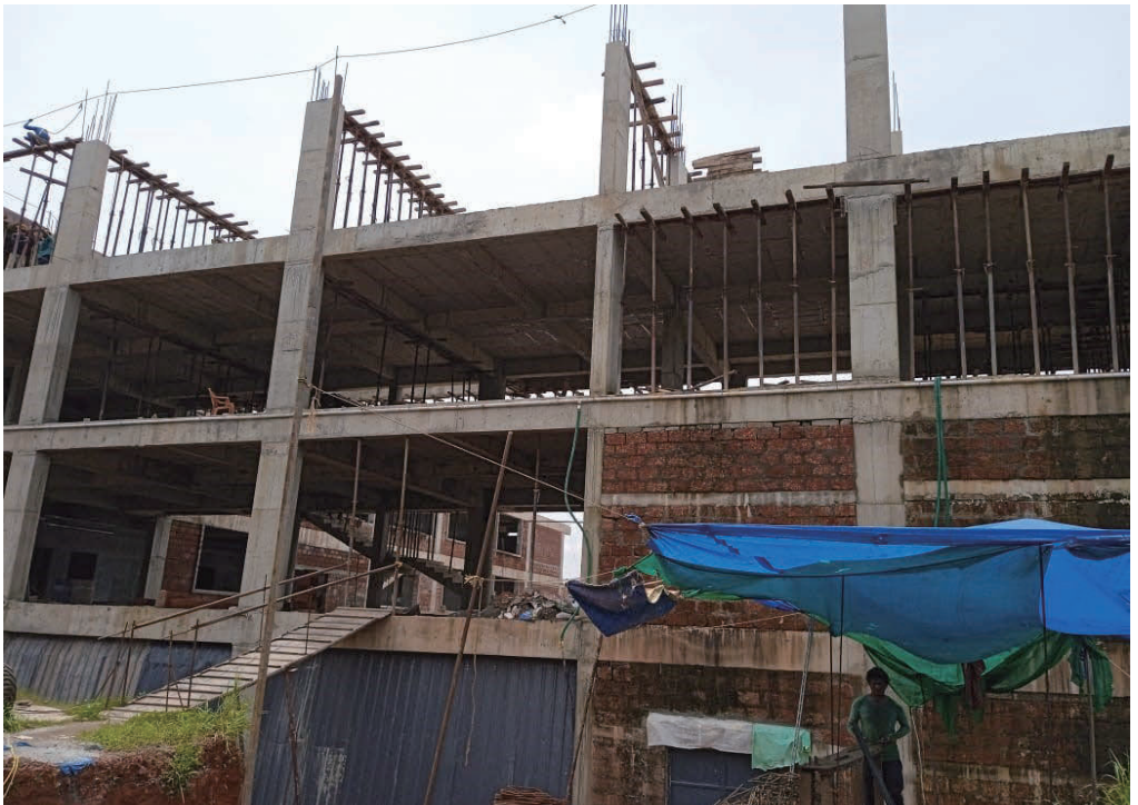
ചിത്രം 5.6: ഹിൽസിനായി കെട്ടിടം, മർകസ് നോളഡ്ജ് സിറ്റി, കൈതപ്പൊയിൽ, കോഴിക്കോട്. ഗുണമേന്മയുള്ള സുരക്ഷാവല ഉപയോഗിക്കാത്തത്. ഓഡിറ്റ് പാർട്ടി 2023 സെപ്റ്റംബർ 21-ന് എടുത്ത ചിത്രം.

2022 ജനുവരി 18-ന്, കെട്ടിടത്തിന്റെ മൂന്നാം നില കോൺക്രീറ്റ് ചെയ്യുന്നതിനിടെ തകരുകയും, 21 അതിഥി തൊഴിലാളികൾക്കും രണ്ട് തദ്ദേശ തൊഴിലാളികൾക്കും പരിക്കേൽക്കുകയും ചെയ്തു.