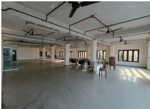
ചിത്രം 5.1 : വാടകയ്ക്ക് നൽകാതെ ഒഴിഞ്ഞു കിടക്കുന്ന ഇടപ്പള്ളിയിലുള്ള ബിസിനസ്സുഡബ്ബിൾ എറണാകുളം ജില്ലാ ഓഫീസ് കെട്ടിടത്തിന്റെ രണ്ടാം നില, 2023 ഒക്ടോബർ 11 -ന് ഓഡിറ്റ് പാർട്ടി എടുത്ത ചിത്രം.

ക്ഷേമ നടപടികൾക്കായി സെസ്സ് ഫണ്ട് വിനിയോഗിക്കുന്നതിനെക്കുറിച്ച് നിയമത്തിലെ 22-ാം വകുപ്പ് പ്രത്യേകം പരാമർശിക്കുന്നു. കൂടാതെ, കേരള ചട്ടങ്ങളിലെ ചട്ടം 309-നെ , ചട്ടം 310(2)-നോടൊപ്പം ചേർത്തു വായിക്കുമ്പോൾ, സർക്കാരിന്റെ മുൻകാല അനുമതിയില്ലാതെ ഫണ്ട് മറ്റൊരു ആവശ്യത്തിനും ചെലവഴിക്കരുതെന്നും ഫണ്ട് കൈകാര്യം ചെയ്യുന്നതിനായി സർക്കാർ ചെലവഴിക്കുന്ന തുക വായ്പയായി കണക്കാക്കണമെന്നും അത് ഫണ്ടിന്റെ അഡ്മിനിസ്ട്രേറ്റീവ് അക്കൗണ്ടിൽ നിന്ന്