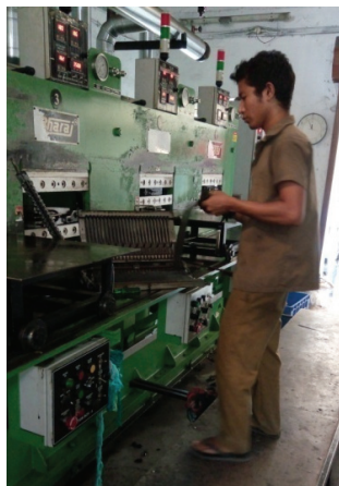
ചിത്രം 6.2 റബ്ബർ മോൾഡിംഗ് മെഷീനിൽ പണിയെടുക്കുമ്പോൾ പിപിഇ ഉപയോഗിക്കാത്തത്-ലിഡോ റബ്ബർ പ്രോഡക്റ്റ്സ് വെസ്റ്റ് ഹിൽ കോഴിക്കോട് (2017 മെയ് 30)

ലാക്ഷണിക പരിശോധന നടത്തിയ 90 ഫാക്ടറികളിൽ 24 എണ്ണത്തിൽ അഗ്നിശമന ഉപകരണങ്ങളായ ഫയർ ബക്കറ്റോ, ഫയർ എക്സ്റ്റിംഗ്വിഷറോ ലഭ്യമാക്കിയിരുന്നില്ല എന്ന് സംയുക്ത പരിശോധനയിൽ ഓഡിറ്റ് കണ്ടു. 18 ഫാക്ടറികളിൽ ഫയർ എക്സ്റ്റിംഗ്വിഷർ കാലാവധി കഴിഞ്ഞതിനുശേഷം റീഫിൽ ചെയ്യാതിരുന്നപ്പോൾ, 10 ഫാക്ടറികളിൽ ഫയർ