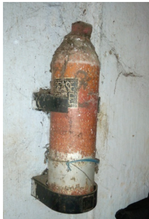
ചിത്രം 6.1 കോഴിക്കോട് വെസ്റ്റ് ഹില്ലിലെ ബ്രിഡ്ജ് ഐസ് പ്ലാന്റിയിലെ മോശമായി സൂക്ഷിച്ചിരുന്ന ഫയർ എക്സ്റ്റിംഗ്വിഷർ (2017 മെയ് 18)

(ഉറവിടം: സംയുക്ത ഭൗതികപരിശോധനാ റിപ്പോർട്ട്)