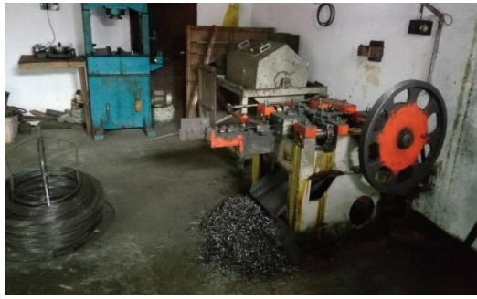
ചിത്രം 6.3 നെയിൽ കട്ടിംഗ് മെഷീന്റെ ചലിക്കുന്ന ഭാഗങ്ങളിൽ വേലി ഇല്ലാത്തത്/സംരക്ഷിക്കാത്തത് - കേരള വയേഴ്സ് ആന്റ് നെയിൽസ്, പയ്യോളി, കോഴിക്കോട് (2017 മെയ് 21)

മറയ്ക്കാതിരുന്ന സ്ക്രൂ ക്ലാസിഫയറിന്റെ ഡ്രൈവിൽ വീണ് ഒരു തൊഴിലാളി മരിച്ചിരുന്നു.