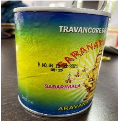
ചിത്രം 2.1: പൂർണ്ണമായ ലേബലിംഗ് വിവരങ്ങൾ ഇല്ലാത്ത അരവണ പ്രസാദത്തിന്റെ ടിൻ 20.09.2021-ന് ഓഡിറ്റ് പാർട്ടി എടുത്ത ചിത്രം

അരവണ പ്രസാദം അടങ്ങിയ സീൽ ചെയ്ത ടിന്നിലെ ലേബൽ ഓഡിറ്റ് വിശകലനം ചെയ്തപ്പോൾ അതിൽ പേര്, ബാച്ച് നമ്പർ, നിർമ്മാതാവിന്റെ പേരും വിലാസവും, പാക്കിംഗ് തീയതി എന്നിവ മാത്രമേ അടങ്ങിയിട്ടുള്ളൂ എന്ന് ശ്രദ്ധയിൽപ്പെട്ടു. റെഗുലേഷൻ നിഷ്കർഷിക്കുന്ന മറ്റ് വിവരങ്ങൾ, പ്രത്യേകിച്ച്, 'കാലഹരണപ്പെടുന്ന തീയതി' ലേബലിൽ ഉൾപ്പെടുത്തിയിട്ടില്ല. ആവശ്യമായ വിശദാംശങ്ങൾ അടങ്ങിയ ലേബലിന്റെ അഭാവം ഉപയോക്താവിന് ഭക്ഷണത്തിന്റെ ചേരുവകൾ, സുരക്ഷിതമായി ഉപയോഗിക്കാൻ