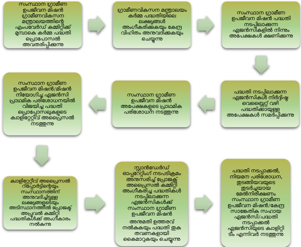
ചിത്രം 4.1 : ഡിഡിയു-ജികെവൈ പദ്ധതിയുടെ നിർവ്വഹണ പ്രക്രിയ

മാർഗ്ഗനിർദ്ദേശങ്ങൾ അനുസരിച്ച്, സംസ്ഥാന ഗ്രാമീണ ഉപജീവന ദൗത്യം (എസ്ആർഎൽഎം) ആയ കുടുംബശ്രീയെ സംസ്ഥാനത്ത് ഡിഡിയു-ജികെവൈയ്ക്ക് സഹ-ഫണ്ടിംഗിനും പദ്ധതി നടപ്പിലാക്കുന്നതിനുള്ള പിന്തുണ നൽകുന്നതിനും പ്രധാന