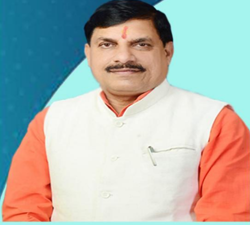
डॉ. मोहन यादव मुख्यमंत्री, मध्यप्रदेश