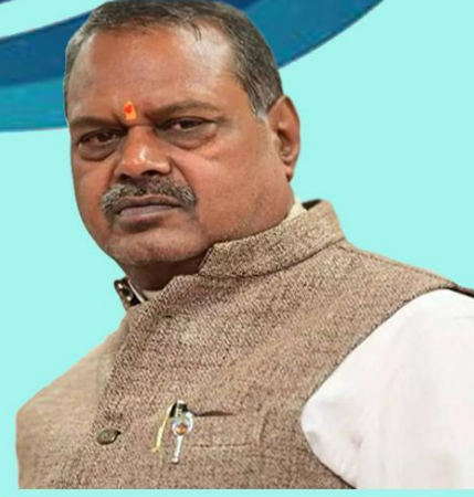
श्री नारायण सिंह कुशवाह मंत्री, मध्यप्रदेश