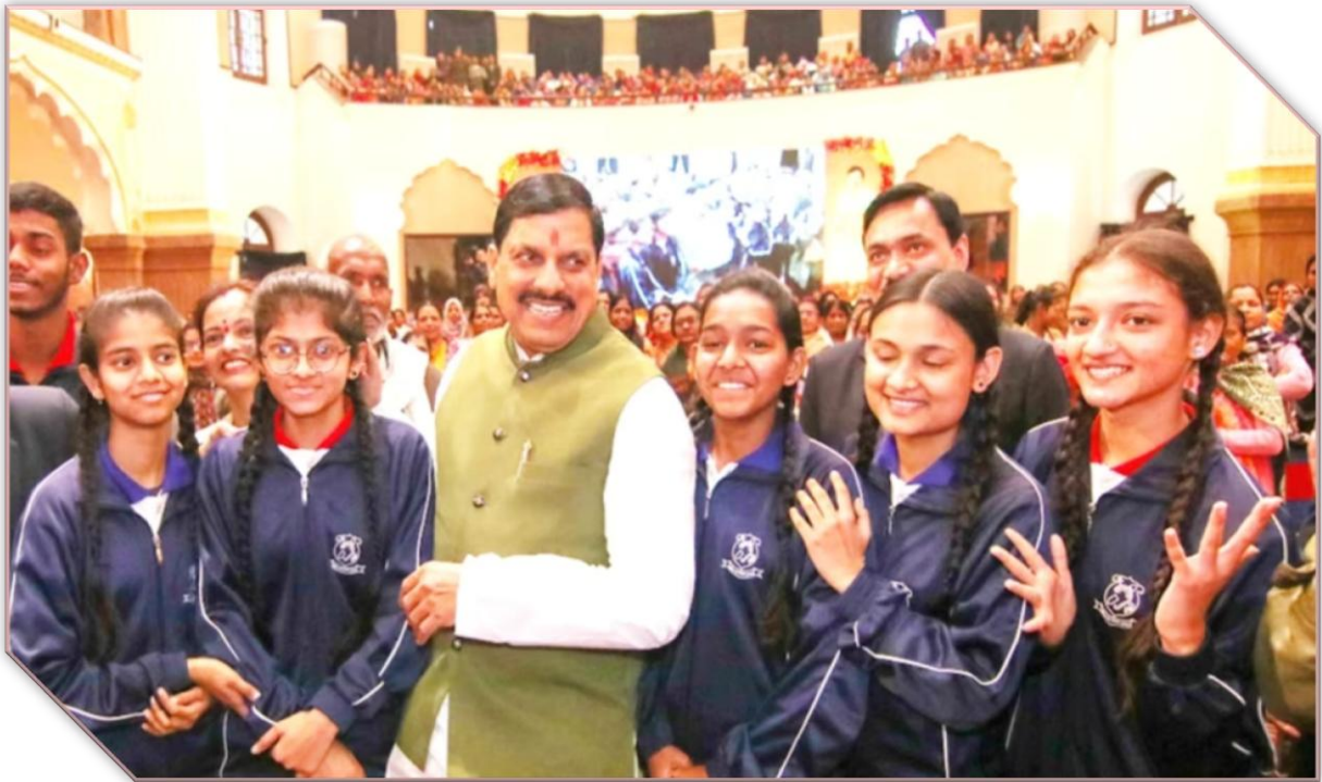
माननीय मुख्यमंत्री डॉ. मोहन यादव विभागीय दिव्यांग विद्यार्थियों के साथ सिंगल विलक पेंशन वितरण कार्यक्रम में