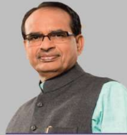
श्री शिवराज सिंह चौहान, मुख्यमंत्री