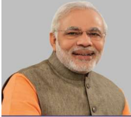
श्री नरेन्द्र मोदी, प्रधानमंत्री