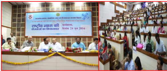
राष्ट्रीय न्याय की योजनाओं का क्रियान्वयन राज्य स्तरीय समन्वय समिति की बैठक दिनांक 24 जून 2016