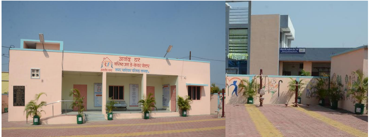
डे-केयर सेंटर – नगर पालिका परिषद नागदा, उज्जैन

वरिष्ठ नागरिकों के लिये दिन में समय व्यतीत करने हेतु मनोरंजन केन्द्र “डे केयर सेंटर” संचालन का कार्यक्रम प्रारम्भ किया गया है। डे केयर सेंटर में कैरम, शतरंज, पठन-पाठन हेतु पुस्तकें, दैनिक समाचार पत्र, पत्रिकाएं आदि रखी जाती हैं। इनका संचालन, स्थानीय नगरीय निकाय, पंचायतों तथा अशासकीय संस्थाओं के माध्यम से किया जा रहा है। प्रदेश में 82 डे केयर सेंटर स्थापित होकर संचालित हैं। (डे-केयर सेंटर की सूची परिशिष्ट-3 पर उपलब्ध है।)