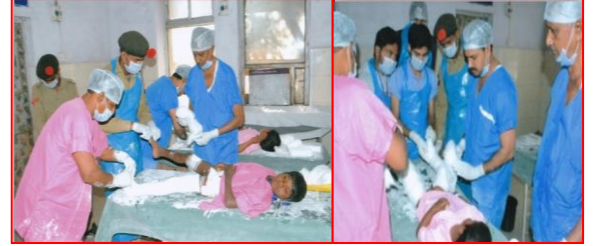
दिव्यांगजनों हेतु विशेष शल्य चिकित्सा शिविर जिला विदिशा दिनांक 14,15 एवं 16 दिसम्बर 2016