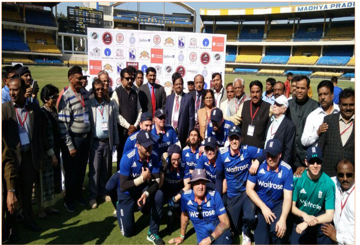
भारत एवं इंग्लैण्ड के मध्य अंतर्राष्ट्रीय दृष्टिबाधित क्रिकेट मैच इंदौर दिनांक 2 फरवरी 2017 (भारत विजय)