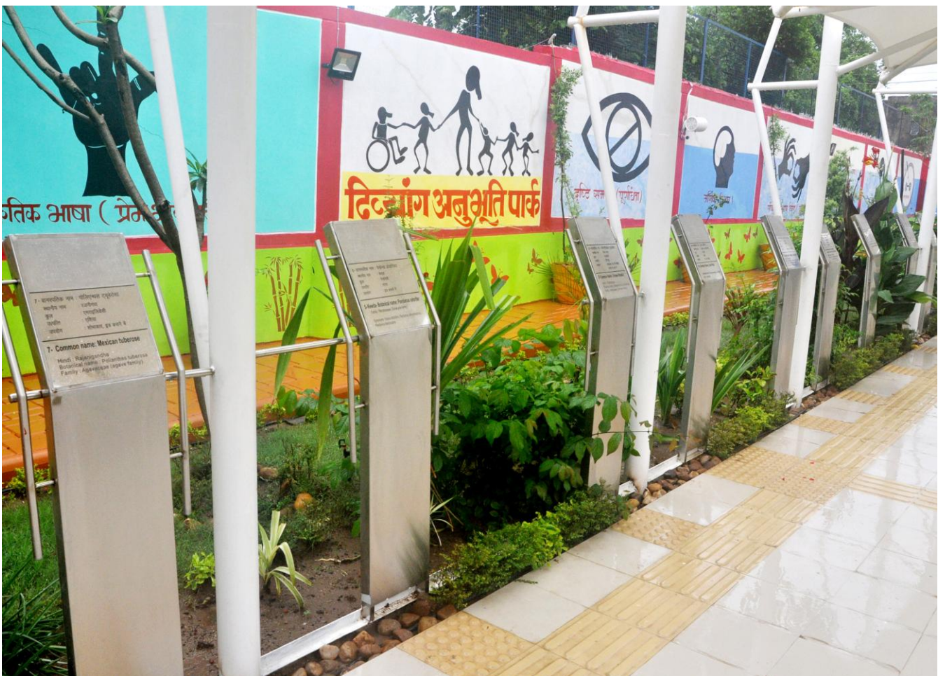
दिव्यांग अनुभूति पार्क— जिला होशंगाबाद, मध्यप्रदेश