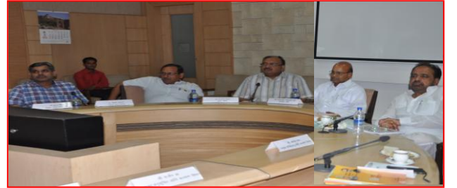
माननीय श्री थावरचंद गहलोत, केन्द्रीय मंत्री, सामाजिक न्याय एवं अधिकारिता मंत्रालय की बैठक दिनांक 2 जून 2016