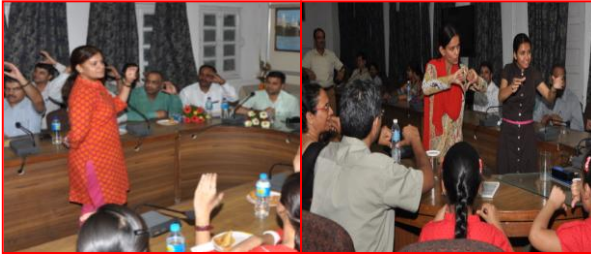
सांकेतिक भाषा (साईन लैंग्वेज) का प्रशिक्षण दिनांक 3 से 13 मई 2016 तक