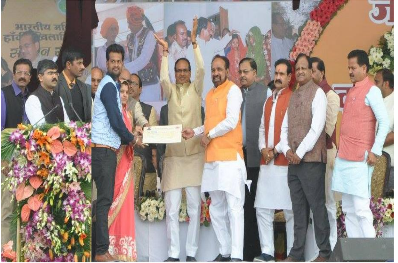
कल्याणकारी योजनाओं का प्रशिक्षण कार्यक्रम