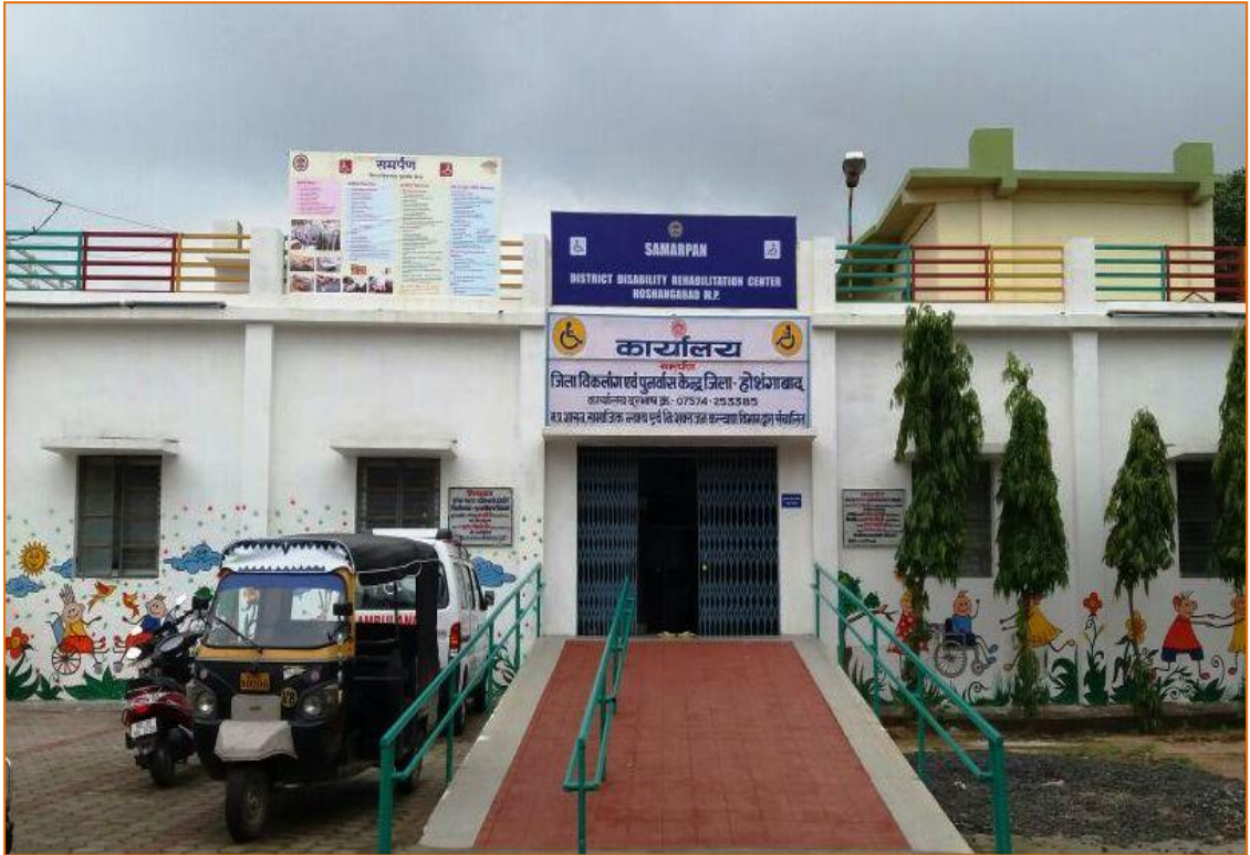
जिला विकलांग पुर्नवास केन्द्र, होशंगाबाद, मध्यप्रदेश

उपरोक्त केन्द्रों के अतिरिक्त राज्य शासन द्वारा 27 जिला विकलांग पुनर्वास केन्द्र यथा जिला बैतूल, होशंगाबाद, हरदा, रायसेन, पन्ना, छतरपुर, कटनी, सिवनी, मण्डला, डिण्डोरी, नरसिंहपुर, शहडोल, उमरिया, भिण्ड, मुरैना, श्योपुर, दतिया, धार, बडवानी, टीकमगढ़, सीधी, अनूपपुर, अशोकनगर, बुरहानपुर, भोपाल, सिंगरोली एवं अलीराजपुर में जिला विकलांग पुनर्वास केन्द्र स्थापित किये हैं। इन केन्द्रों के माध्यम से प्रदेश के निःशक्तजन लाभान्वित हो रहे हैं।