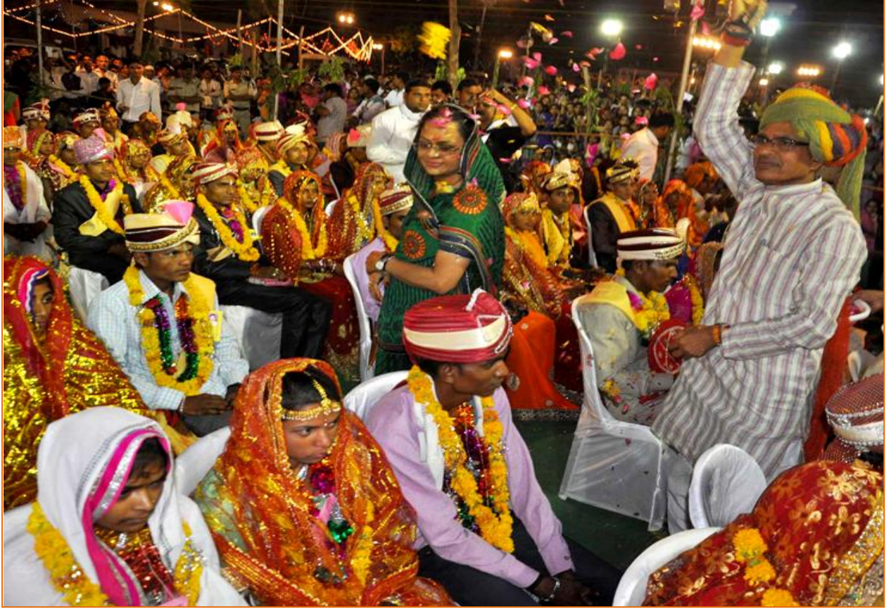
सामूहिक विवाह कार्यक्रम – माननीय श्री शिवराजसिंह चौहान, मुख्यमंत्री, मध्यप्रदेश।