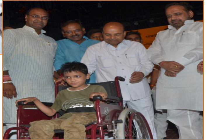
निःशक्तजनों को सहायक उपकरण वितरण – माननीय श्री थावरचंद गहलोत, केन्द्रीय मंत्री, सामाजिक न्याय एवं अधिकारिता मंत्रालय, माननीय श्री शिवराजसिंह चौहान, मुख्यमंत्री, मध्यप्रदेश एवं माननीय श्री गोपाल भार्गव, मंत्री, सामाजिक न्याय एवं निःशक्तजन कल्याण विभाग, मध्यप्रदेश