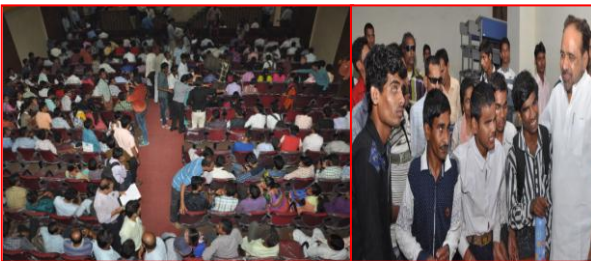
आई.टी.आई. में प्रवेश दिनांक 25 से 26 जुलाई 2016