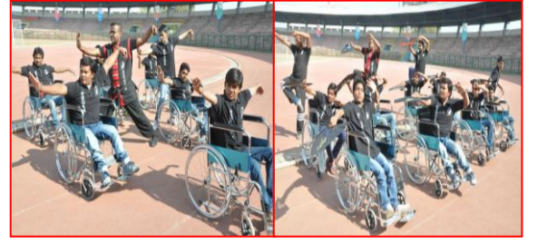
निःशक्तजनों द्वारा कराटे का प्रदर्शन भोपाल दिनांक 3.12.2016