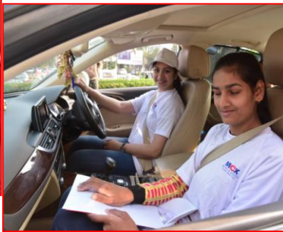
अशासकीय संस्था आरुषि भोपाल द्वारा आयोजित दृष्टिबाधित व्यक्तियों के लिए कार रैली दिनांक 8.1.2017