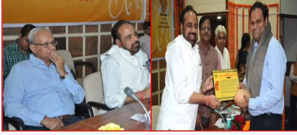
डे-केयर सेंटर्स का एक दिवसीय राज्य स्तरीय सम्मेलन दिनांक 08 नवम्बर 2016