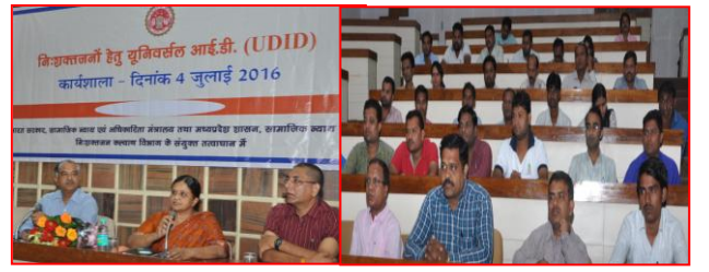
निःशक्तजनों हेतु यूनिवर्सल आई.डी. (UDID) कार्यशाला दिनांक 4 जुलाई 2016