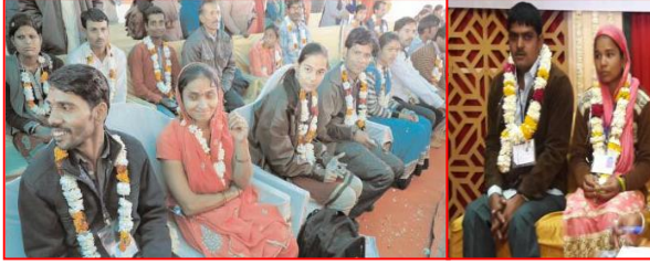
निःशक्त परिचय सम्मेलन उज्जैन दिनांक 3.12.2016