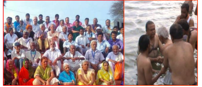
आसरा वृद्धाश्रम भोपाल के अंतःवासियों का सिंहस्थ भ्रमण उज्जैन दिनांक 20.5.2016