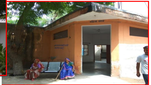
प्रदेश में संचालित वृद्धाश्रम