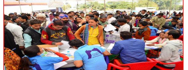
निःशक्त रोजगार मेला - इंदौर दिनांक 13.1.2017