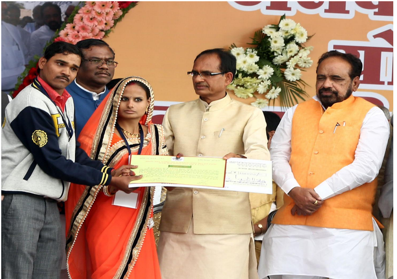
निःशक्तजनों को सहायता राशि वितरण