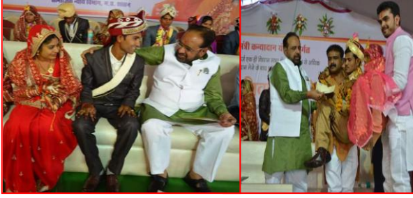
सामूहिक विवाह कार्यक्रम-दिनांक 22.4.2016