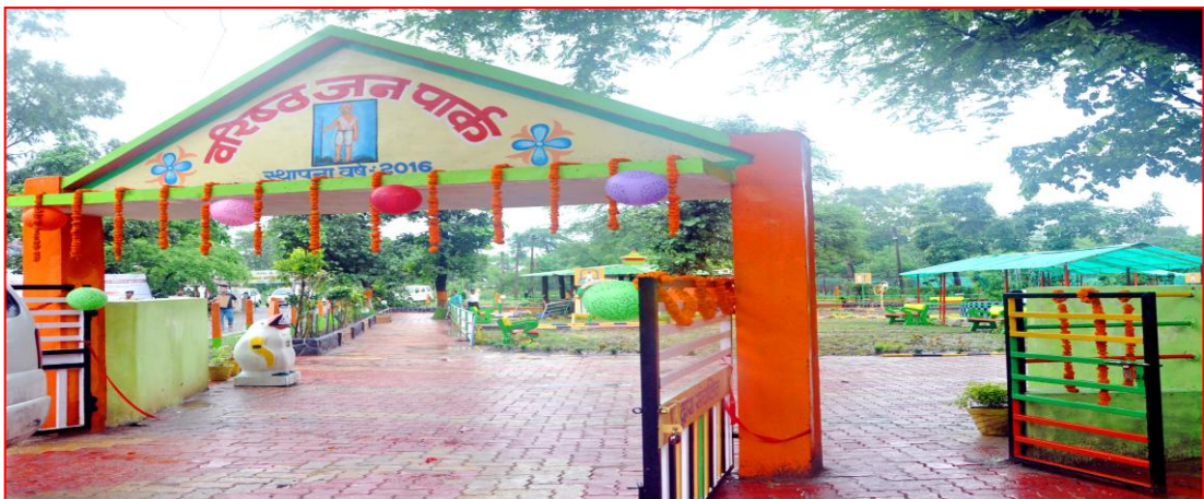
वरिष्ठजन पार्क – जिला होशंगाबाद