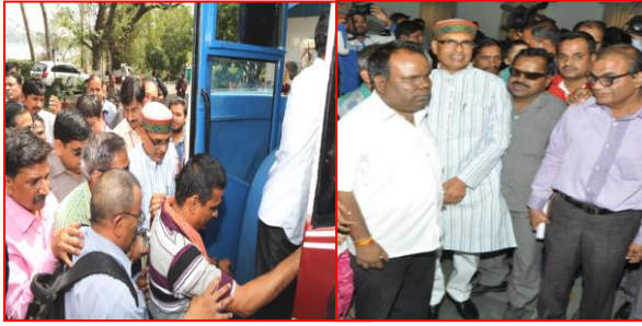
दृष्टिबाधित निःशक्तजनों का सिंहस्थ भ्रमण उज्जैन दिनांक 19.5.2016