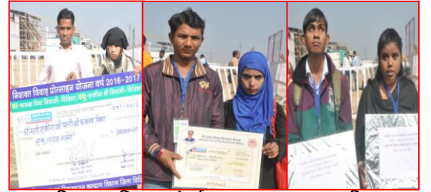
निःशक्त विवाह अंतर्गत प्रदाय सहायता राशि दिनांक 4.12.2016