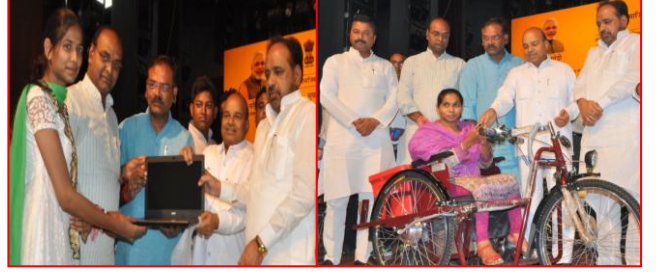
एलिम्को/भारत सरकार- कृत्रिम अंग उपकरण प्रदाय जिला भोपाल दिनांक 8.5.2016