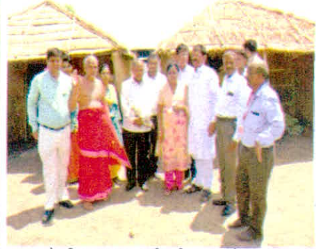
मा. केन्द्रीय आयुष मंत्री श्रीपद यशोनायक द्वारा सिंहस्थ मेले में आयुष की गतिविधियों का निरीक्षण