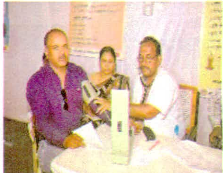
सिंहस्थ मेले में लगाये गये आयुष चिकित्सा शिविरों से लाभ प्राप्त करते श्रद्धालु