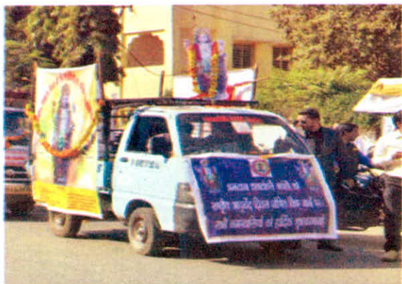
राष्ट्रीय आयुर्वेद दिवस पर प्रचार रथ जिला सिवनी