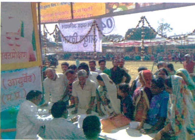
जिला सागर में आयोजित शहर उदय योजना में आयुष विभाग द्वारा लगाये गये चिकित्सा शिविर में चिकित्सीय लाभ प्राप्त करते जन मानस