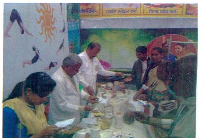
जिला सागर में आयोजित शहर उदय योजना में आयुष विभाग द्वारा लगाये गये चिकित्सा शिविर में चिकित्सीय लाभ प्राप्त करते जन मानस