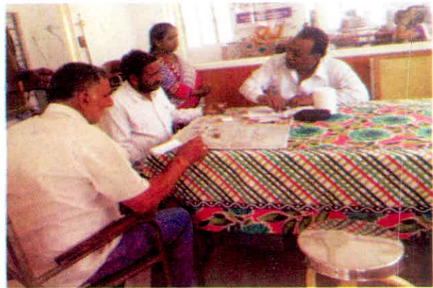
राष्ट्रीय आयुर्वेद दिवस पर लगाये गया चिकित्सा शिविर