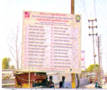
सिंहस्थ मेले में आये श्रद्धालुओं हेतु आयुष चिकित्सा सुविधाओं की जानकारी