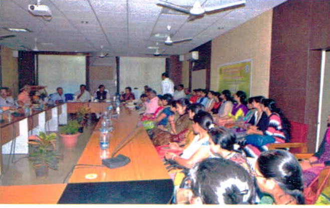
मा. केन्द्रीय आयुष मंत्री श्रीपाद यशोनायक की धनवंतरी प्रशिक्षण प्राप्त कर रहे चिकित्सकों को उद्बोधन