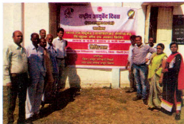
राष्ट्रीय आयुर्वेद दिवस पर जिला सिवनी में लगाये गया चिकित्सा शिविर