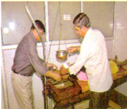
सिंहस्थ मेले में लगाये गये आयुष चिकित्सा शिविरों में प्रचकर्म चिकित्सा द्वारा श्रद्धालुओं को चिकित्सालाभ