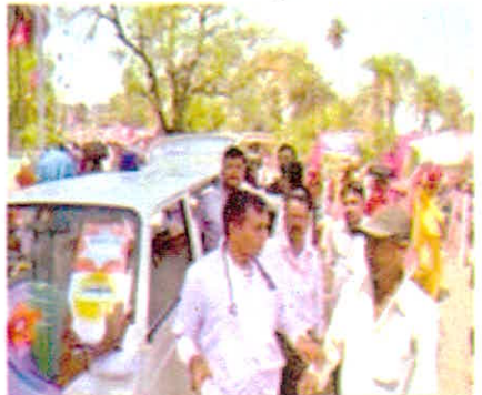
सिंहस्थ मेले में आये श्रद्धालुओं को चिकित्सा लाभ प्रदान करने आयुष मोबाईल बेन