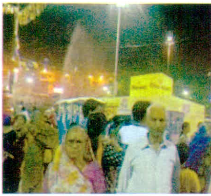
सिंहस्थ मेले में लगाये गये आयुष चिकित्सा शिविरों से लाभ प्राप्त करते श्रद्धालु