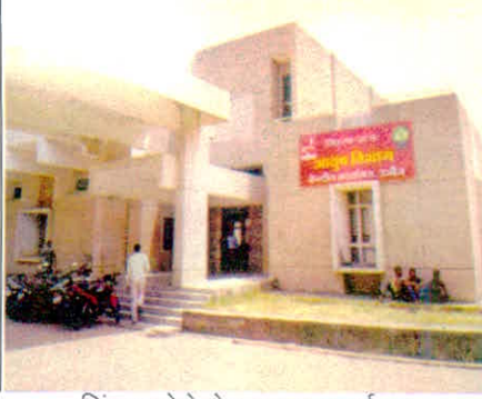
सिंहस्थ मेले हेतु आयुष कार्यालय