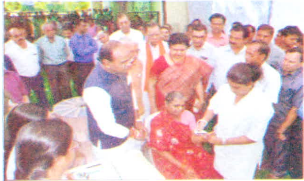
राष्ट्रीय आयुर्वेद दिवस पर मधुमेह के संबंध में जनमानस हेतु जानकारी