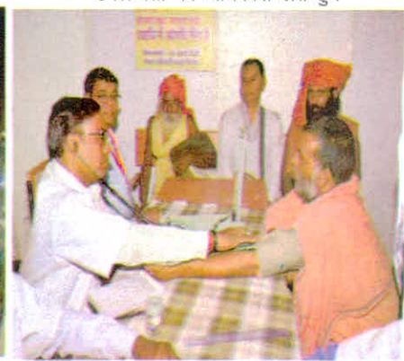
सिंहस्थ मेले में लगाये गये आयुष चिकित्सा शिविरों से लाभ प्राप्त करते श्रद्धालु