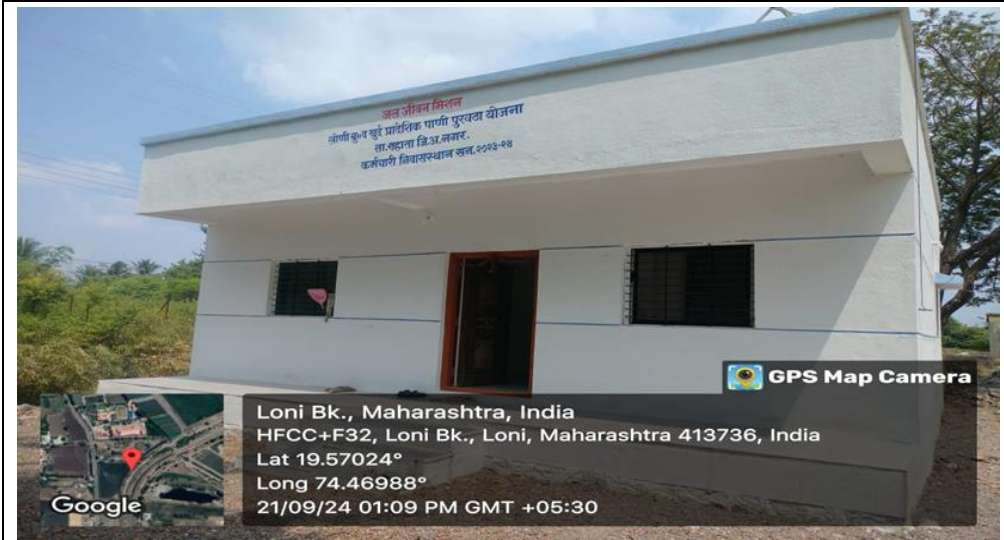
छायाचित्र 3: लोणी बुद्रुक, जिल्हा अहिल्यानगर येथे निवासी क्वार्टर

अहिल्यानगरच्या राहुरी आणि रहाटा तालुक्यांमध्ये, ब्राह्मणी बहुग्राम योजना आणि लोणी बुद्रुक व खुर्द योजनेच्या पाणी पुरवठा योजनांच्या कामांतर्गत कर्मचाऱ्यांसाठी तीन निवासी क्वार्टर्सच्या बांधकामाची तरतूद करण्यात आली होती. या क्वार्टर्ससाठी अंदाजित खर्च ₹ 47.12 लाख होता, ज्यापैकी ₹ 8.71 लाख अदा करण्यात आले, ज्यामुळे या निवासी क्वार्टर्सवर ₹ 38.41 लाखांचे दायित्व निर्माण झाले, जे जेजेएम अंतर्गत स्वीकार्य नव्हते. प्रत्यक्ष पाहणीदरम्यान, छायाचित्र 3 मध्ये दाखवल्याप्रमाणे, निवासी क्वार्टर्सचे बांधकाम पूर्णत्वाच्या टप्प्यात असल्याचे आढळून आले.