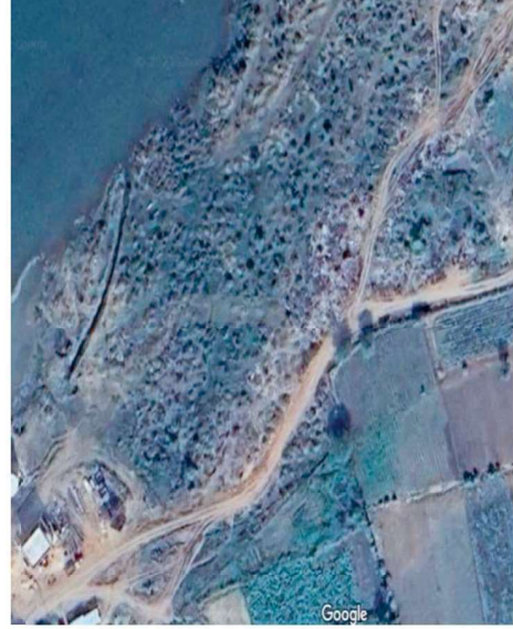
नगर पंचायत राजिम, अक्षांश 20.97980, देशांतर 81.88659