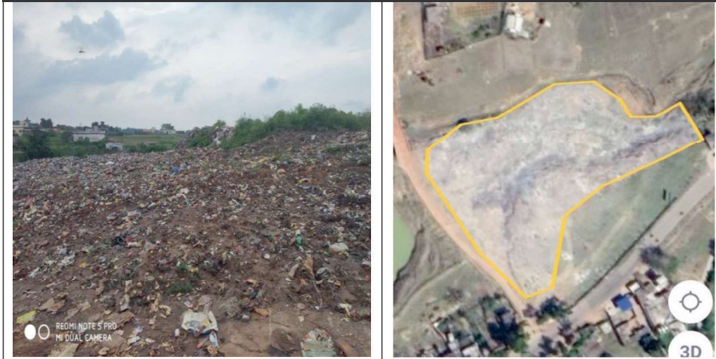
नगरपालिका परिषद जशपुर, अक्षांश 22.89500, देशांतर 84.15607