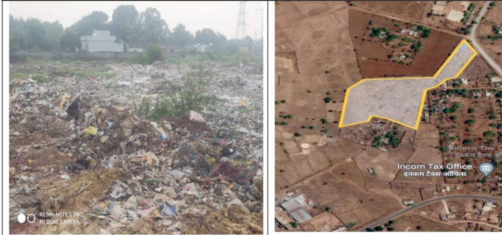
नगरपालिका परिषद, भाटापारा, अक्षांश 21.734865, देशांतर 81.972123