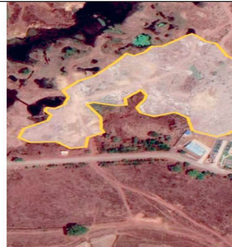
नगरपालिका परिषद कुम्हारी, अक्षांश 21.269403, देशांतर 81.530512