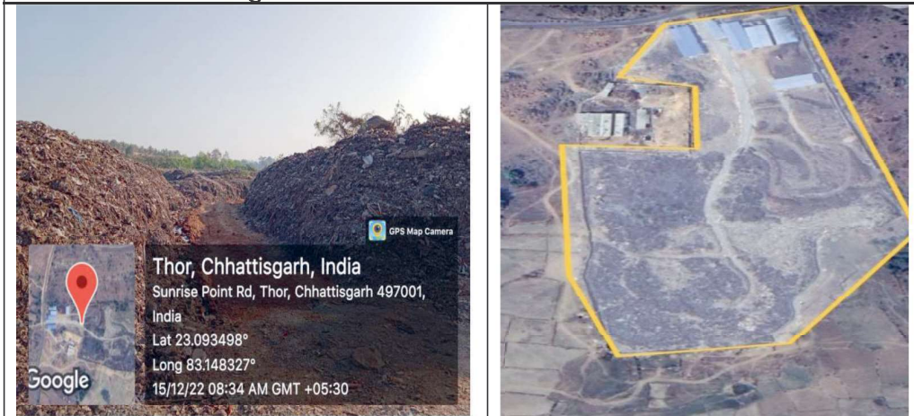
नगर पालिक निगम अम्बिकापुर, अक्षांश 23.093647, देशांतर 83.147312