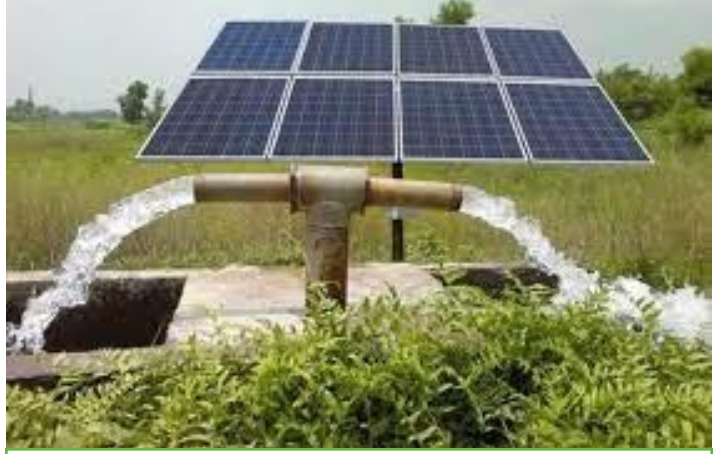
ಭಾಯಾಚಿತ್ರ ಸಂಖ್ಯೆ 3.1: ಸೌರ ನೀರು ಎತ್ತುವ ಪಂಪು

ಕಾರ್ಯಕ್ರಮವನ್ನು ವಹಿಸಲಾಗಿದ್ದಿತು (ಸೆಪ್ಟೆಂಬರ್ 2014). ಈ ಕಾರ್ಯಕ್ರಮವು ಬೆಳೆಗಳಿಗೆ ನೀರಾವರಿ ಸೌಲಭ್ಯಗಳಿಗಾಗಿ ವರ್ಷದ ಬಹಳಷ್ಟು ಅವಧಿಯಲ್ಲಿ ಹಗಲು ಹೊತ್ತಿನಲ್ಲಿ ಲಭ್ಯವಿರುವಂತಹ ಗ್ರಿಡ್