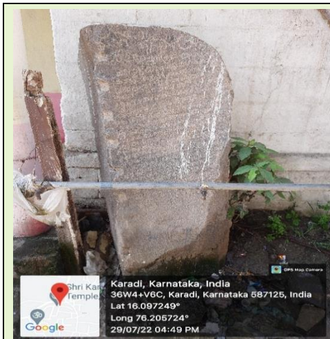
ಚಿತ್ರ ಸಂಖ್ಯೆ 3.12: ಲಿಂಗಸುಗೂರು ತಾಲ್ಲೂಕಿನ ಕರಡಿ ಗ್ರಾಮದಲ್ಲಿ ಜಂಟಿ ಪರಿಶೀಲನೆಯ ವೇಳೆಯಲ್ಲಿ ಗಮನಿಸಲಾದಂತಹ ಶಿಲಾಶಾಸನ.