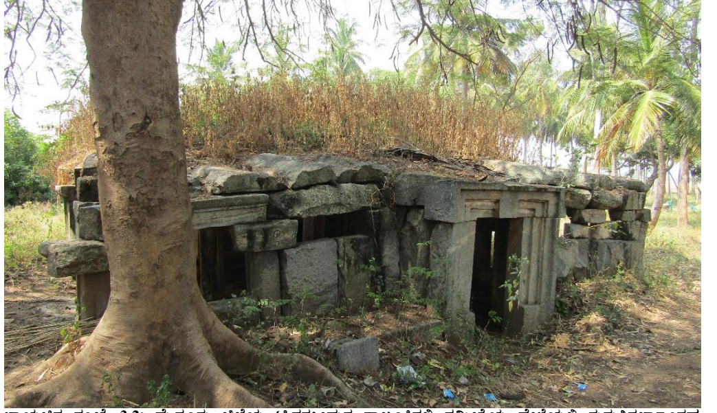
ಭಾಯಚಿತ್ರ ಸಂಖ್ಯೆ 3.2: ಮೈಸೂರು ಜಿಲ್ಲೆಯ ಟಿನರಸೀಪುರ ತಾಲ್ಲೂಕಿನಲ್ಲಿ ಸಮೀಕ್ಷೆಯ ವೇಳೆಯಲ್ಲಿ ಗುರುತಿಸಲಾದಂತಹ ಒಂದು ಸಂರಕ್ಷಿಸಿದ ಪ್ರಾಚೀನ ಸ್ಮಾರಕವು ಪಾಳು ಬಿದ್ದಿರುವುದು.

ಈ ರೀತಿಯಾಗಿ ಸಂರಕ್ಷಿಸಿದ ಪ್ರಾಚೀನ ಸ್ಮಾರಕಗಳ ಗುರುತಿಸುವಿಕೆಯಲ್ಲಿನ ವಿಳಂಬ ಹಾಗೂ ಅಧಿಸೂಚನೆಯನ್ನು ಹೊರಡಿಸುವಲ್ಲಿನ ಕೊರತೆಯು ಅವುಗಳ ಶಿಥಿಲಾವಸ್ಥೆಯನ್ನು ಇನ್ನೂ ಉಲ್ಬಣಗೊಳಿಸಿರುವವು. ಇದು ಇಲಾಖೆಯಲ್ಲಿನ ಅನುಸರಣಾ ಕ್ರಮಗಳ ಕೊರತೆಯನ್ನು ಸೂಚಿಸುತ್ತಿದ್ದಿತು.