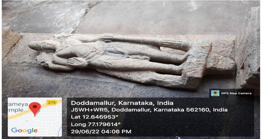
ಚಿತ್ರ ಸಂಖ್ಯೆ 3.11: ಚೆನ್ನಪಟ್ಟಣ ತಾಲ್ಲೂಕಿನ ಶ್ರೀ ಅಪ್ರಮೇಯ ಸ್ವಾಮಿ ದೇವಸ್ಥಾನದಲ್ಲಿ ಬಿದ್ದಿರುವಂತಹ ಪ್ರಾಚೀನ ಹಸ್ತಕೃತಿಗಳು.

ಇಲಾಖೆಯು ಪ್ರಾಚೀನಾವಶೇಷಗಳನ್ನು ಪ್ರಧಾನ ಸ್ಮಾರಕಗಳಿಂದ ಪ್ರತ್ಯೇಕಗೊಳಿಸಿರುವುದಿಲ್ಲ ಅಥವಾ ಅವುಗಳ ಇರುವಿಕೆಯನ್ನು ದಾಖಲಿಸಿರುವುದಿಲ್ಲ. ಜಂಟಿ ಪರಿಶೀಲನೆಯ ವೇಳೆಯಲ್ಲಿ, ಹೊರತೆಗೆಯಲ್ಪಟ್ಟಿದ್ದಂತಹ ಪ್ರಾಚೀನಾವಶೇಷಗಳು ಸಂರಕ್ಷಿತಗೊಳ್ಳದೆಯೇ ಚದುರಿದಂತೆ ಬಿದ್ದಿದ್ದವು ಎಂಬುದನ್ನು ಲೆಕ್ಕಪರಿಶೋಧನೆಯು ಗಮನಿಸಿತು. ಇಂತಹ ರಕ್ಷಣೆಯಿಲ್ಲದ ಪುರಾತನ ವಸ್ತುಗಳು ಕಳ್ಳತನಕ್ಕೆ ಒಳಗಾಗಿ ಸಾರ್ವಜನಿಕರಿಗೆ ನಷ್ಟವಾಗುತ್ತದೆ. ಹೊರತೆಗೆಯಲ್ಪಟ್ಟಿರುವಂತಹ ಹಾಗೂ ಚದುರಿದಂತೆ ಬಿದ್ದಿರುವಂತಹ ಪ್ರಾಚೀನಾವಶೇಷಗಳ ನಿರರ್ಶನಗಳ ಪೈಕಿ ಮೂರರ ಛಾಯಾಚಿತ್ರಗಳನ್ನು ಈ ಕೆಳಗೆ ನೀಡಲಾಗಿರುವುದು: