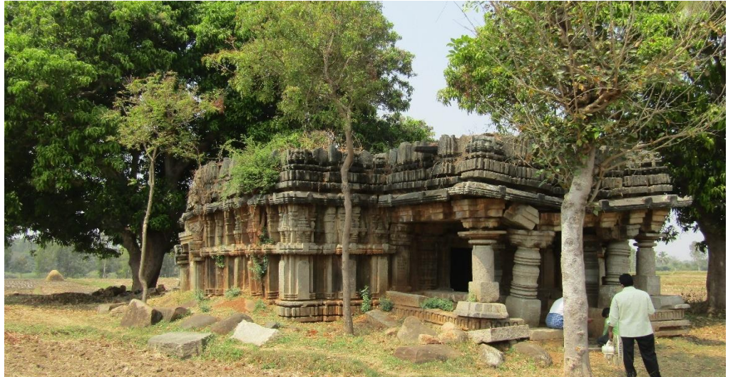
ಭಾಯಚಿತ್ರ ಸಂಖ್ಯೆ 3.1: ಮೈಸೂರು ಜಿಲ್ಲೆಯ ಟಿನರಸೀಪುರ ತಾಲ್ಲೂಕಿನಲ್ಲಿ ಸಮೀಕ್ಷೆಯ ವೇಳೆಯಲ್ಲಿ ಗುರುತಿಸಲಾದಂತಹ ಒಂದು ಸಂರಕ್ಷಿಸಿದ ಪ್ರಾಚೀನ ಸ್ಮಾರಕವು ಶಿಥಿಲಾವಸ್ಥೆಯಲ್ಲಿರುವುದು.

ಮುಂದುವರೆದು 19 ತಾಲ್ಲೂಕುಗಳಲ್ಲಿ 9,552 ಸಂರಕ್ಷಿಸಿದ ಪ್ರಾಚೀನ ಸ್ಮಾರಕಗಳನ್ನು ಗುರುತಿಸಿದಂತಹ ಸಮೀಕ್ಷಾ ವರದಿಗಳನ್ನು ಸಲ್ಲಿಸಿದನಂತರ ಕರ್ನಾಟಕ ಸರ್ಕಾರ / ಇಲಾಖೆಯು ಗ್ರಾಮ ಸಮೀಕ್ಷೆಯ ವೇಳೆಯಲ್ಲಿ ಗುರುತಿಸಲಾಗಿದ್ದಂತಹ ಸ್ಮಾರಕಗಳಿಗೆ ಸಂಬಂಧಿಸಿದಂತೆ ಅಧಿಸೂಚನೆಗಳನ್ನು ಹೊರಡಿಸಿರಲಿಲ್ಲ. ಅಂತಹ ಸಂರಕ್ಷಿಸಿದ ಕೆಲವು ಪ್ರಾಚೀನ ಸ್ಮಾರಕಗಳ ಸ್ಥಿತಿಗತಿಗಳನ್ನು ಈ ಕೆಳಗೆ ಚಿತ್ರಿಸಲಾಗಿದೆ.