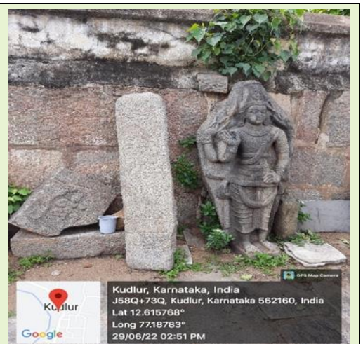
ಚಿತ್ರ ಸಂಖ್ಯೆ 3.13: ಚೆನ್ನಪಟ್ಟಣ ತಾಲ್ಲೂಕಿನ ಶ್ರೀ ರಾಮದೇವರು ಸೀತಾದೇವಿ ದೇವಸ್ಥಾನದ ಹೊರಗಡೆ ಬಿದ್ದಿರುವಂತಹ ಪ್ರಾಚೀನ ಹಸ್ತಕೃತಿಗಳು.