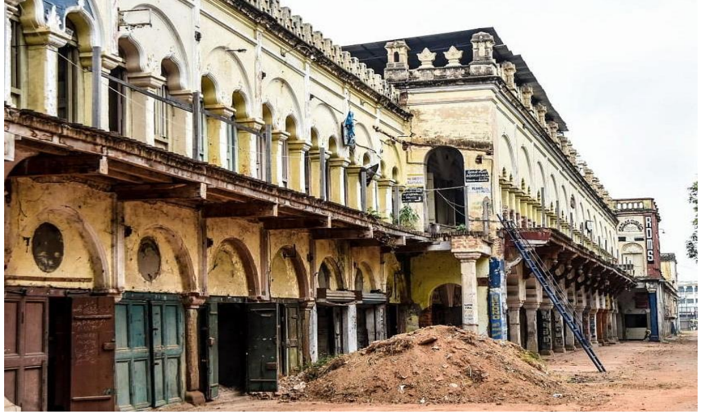
ಭಾಯಾಚಿತ್ರ ಸಂಖ್ಯೆ 3.16: ಮೈಸೂರಿನಲ್ಲಿ ಒಂದು ಪಾರಂಪರಿಕ ಸ್ಮಾರಕ ಕಟ್ಟಡ ಎಂಬುದಾಗಿ ಗುರುತಿಸಲ್ಪಟ್ಟಿರುವ ಲ್ಯಾನ್ಡ್‌ಮಾರ್ಕ್ ಕಟ್ಟಡವು ಕುಸಿತಗೊಳ್ಳುವ ಸ್ಥಿತಿಯಲ್ಲಿರುವುದು.

ಮೈಸೂರು, ಚಾಮರಾಜನಗರ ಮತ್ತು ಕೋಲಾರ ಜಿಲ್ಲೆಗಳನ್ನು ಹೊರತುಪಡಿಸಿದಂತೆ ಪುರಾತತ್ವ ಸ್ಮಾರಕಗಳ ಸಂರಕ್ಷಣಾ ಸಮಿತಿಯನ್ನು ರಚಿಸಿರಲಿಲ್ಲ ಎಂಬುದನ್ನು ಲೆಕ್ಕಪರಿಶೋಧನೆಯು ಗಮನಿಸಿತು. ಸಮಿತಿಯನ್ನು ರಚಿಸಲಾಗಿದ್ದಂತಹ ಜಿಲ್ಲೆಗಳಲ್ಲಿಯೂ ಸಹ ಪಾರಂಪರಿಕ ನಿವೇಶನಗಳು, ಕಟ್ಟಡಗಳನ್ನು ಗುರುತಿಸುವ ಸಲುವಾಗಿ ಸಭೆಗಳನ್ನು ನಿಯತವಾಗಿ ನಡೆಸಿರಲಿಲ್ಲ. ಉದಾಹರಣೆಗೆ 2020-2022ರ ಅವಧಿಯಲ್ಲಿ ಮೈಸೂರು ಜಿಲ್ಲಾ ಸಮಿತಿಯು ಮೂರು ಸಲ, ಕೋಲಾರ ಜಿಲ್ಲಾ ಸಮಿತಿಯು ಒಂದು ಸಲ ಸಭೆ ಸೇರಿದ್ದಿತು ಹಾಗೂ ಚಾಮರಾಜನಗರ ಜಿಲ್ಲಾ ಸಮಿತಿಯು (ನವಂಬರ್ 2020ರಲ್ಲಿ ರಚಿಸಲ್ಪಟ್ಟಿರುವುದು) ಒಂದು ಸಲವೂ ಸಭೆ ಸೇರಿರಲಿಲ್ಲ.