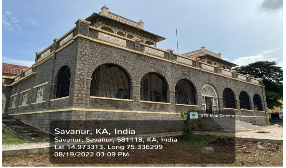
ಭಾಯಾಚಿತ್ರ ಸಂಖ್ಯೆ 3.15: ಇಲಾಖೆಯು ಸಂರಕ್ಷಣಾ ಕಾಮಗಾರಿಗಳನ್ನು ಕೈಗೊಂಡನಂತರ ಸರ್ವೋಚಿತ ನವಾಬನ ಅರಮನೆ.

ಅವುಗಳ ಸಂರಕ್ಷಣಾ ಕಾಮಗಾರಿಗಳ ಮೇಲೆ ವೆಚ್ಚಗಳನ್ನು ಭರಿಸುವ ಮೊದಲು ಈ ಸಂರಕ್ಷಿತಗೊಂಡಿರದ ಸ್ಮಾರಕಗಳ ಬಗ್ಗೆ ಅಧಿಸೂಚನೆಯನ್ನು ಹೊರಡಿಸದಿರಲು ಕಾರಣಗಳು ದಾಖಲೆಗಳಿಂದ ಕಂಡುಬರುತ್ತಿರಲಿಲ್ಲ.