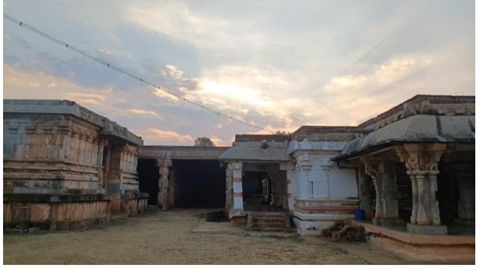
ಛಾಯಾಚಿತ್ರ ಸಂಖ್ಯೆ 3.5: ಚೋಳರ ಅವಧಿಗೆ ಸಂಬಂಧಿಸಿರುವಂತಹ ಚಾಮರಾಜನಗರ ಜಿಲ್ಲೆಯ ಗುಂಡ್ಲುಪೇಟೆ ತಾಲ್ಲೂಕಿನ ತ್ರಿಯಂಬಕಪುರದ ಶ್ರೀ ತ್ರಿಯಂಬಕೇಶ್ವರ ದೇವಸ್ಥಾನ