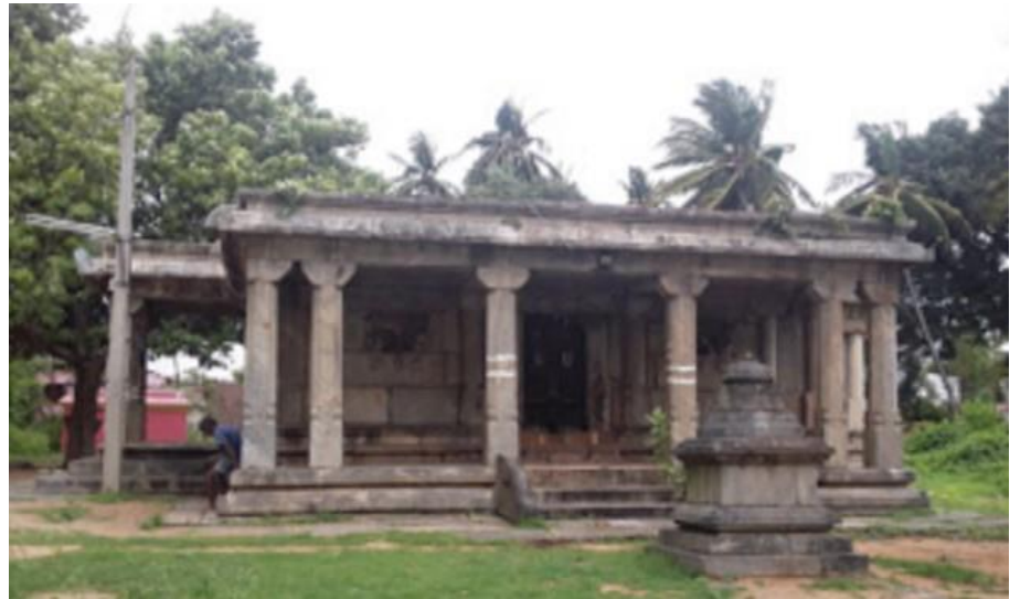
ಛಾಯಾಚಿತ್ರ ಸಂಖ್ಯೆ 3.4: ಚೋಳರ ಅವಧಿಗೆ ಸಂಬಂಧಿಸಿರುವಂತಹ ಶ್ರೀ ಲಕ್ಷ್ಮೀನರಸಿಂಹಸ್ವಾಮಿ ದೇವಸ್ಥಾನ, ಅಗರ ಗ್ರಾಮ, ಯಳಂದೂರು ತಾಲ್ಲೂಕು, ಚಾಮರಾಜನಗರ ಜಿಲ್ಲೆ

ನಿರ್ದೇಶಿಕೆಯಲ್ಲಿ ಸೇರಿಸಲ್ಪಟ್ಟಿರದ ಸ್ಮಾರಕಗಳ ಕೆಲವು ಛಾಯಾಚಿತ್ರಗಳನ್ನು ಈ ಕೆಳಗೆ ನೀಡಲಾಗಿದೆ.