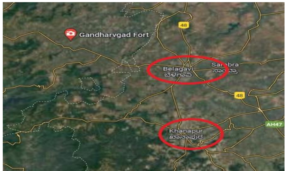
ಭಾಯಾಚಿತ್ರ 3.6: ಮಹಾರಾಷ್ಟ್ರದಲ್ಲಿನ ಗಂದರ್ವಘಡ ಕೋಟೆಯನ್ನು ತೋರಿಸುವ ನಕಾಶೆ