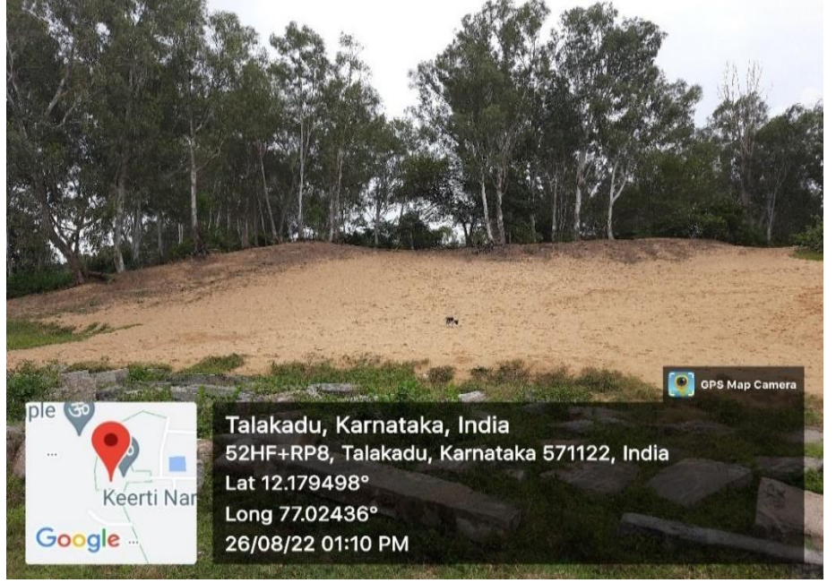
ಭಾಯಾಚಿತ್ರ ಸಂಖ್ಯೆ.3.3: ತಲಕಾಡಿನ ಮರಳು ರಾಶಿಗಳು