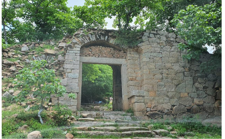
ಭಾಯಾಚಿತ್ರ ಸಂಖ್ಯೆ 2.2: ರಾಯಚೂರು ಜಿಲ್ಲೆಯ ಜಲದುರ್ಗ ಕೋಟೆಯನ್ನು ಸಂರಕ್ಷಿಸಿರುವುದು.