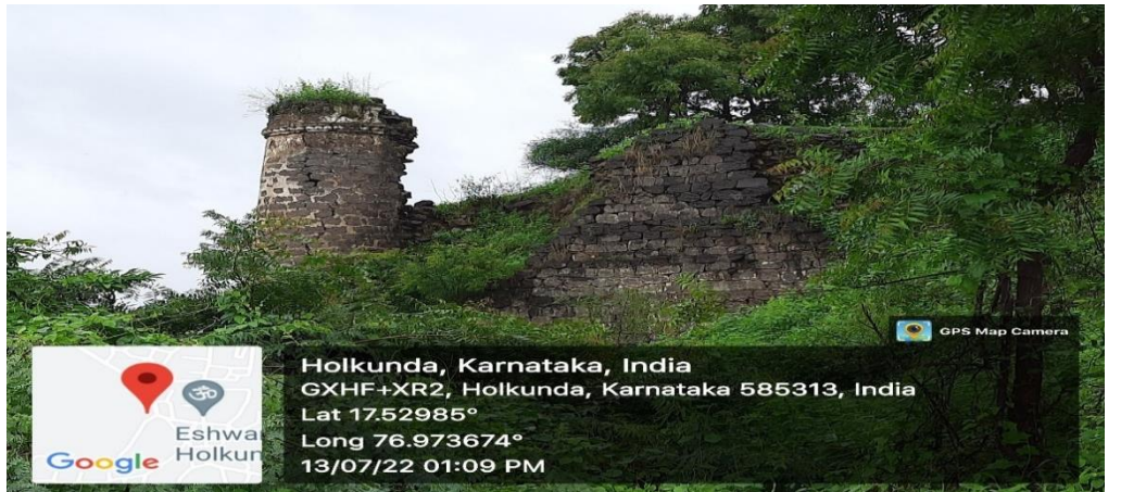
ಭಾಯಾಚಿತ್ರ ಸಂಖ್ಯೆ 2.1: ಕಲಬುರಗಿ ಜಿಲ್ಲೆಯ ಕಲಬುರಗಿ ತಾಲ್ಲೂಕಿನ ಹೊಲಕೊಂಡದಲ್ಲಿನ ಬಹಮನಿ ಗೋಪುರಗಳ ಸ್ಥಿತಿ - ಇವುಗಳು ತತ್ಕ್ಷಣದಲ್ಲಿಯೇ ಸಂರಕ್ಷಣಾ ಕಾರ್ಯದ ಅಗತ್ಯತೆಯನ್ನು ಹೊಂದಿರುತ್ತವೆ.

ಸರ್ಕಾರವು ತನ್ನ ಉತ್ತರದಲ್ಲಿ (ಆಗಸ್ಟ್ 2023) ಲೆಕ್ಕಪರಿಶೋಧನೆಯ ಶಿಫಾರಸನ್ನು ಅನುಸರಣೆಗಾಗಿ ಗುರುತಿಸಲಾಗಿದೆ ಮತ್ತು ದೀರ್ಘಾವಧಿ ಪರಿಪ್ರೇಕ್ಷಣಾ ಯೋಜನೆಯನ್ನು ರೂಪಿಸಲು ಇಲಾಖೆಯು ಒಪ್ಪಿಕೊಂಡಿದೆ ಎಂದು ಹೇಳಿದೆ.