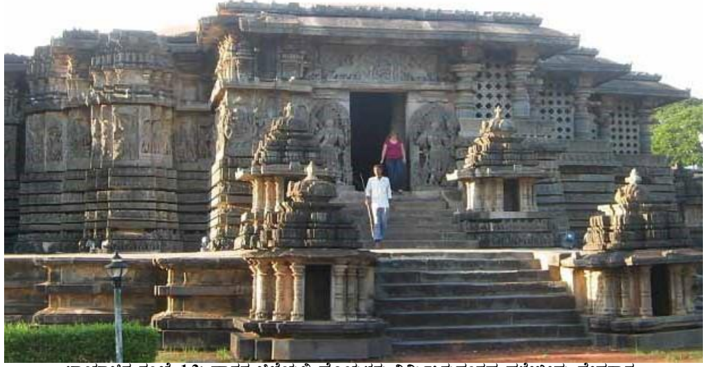
ಭಾಯಾಚಿತ್ರ ಸಂಖ್ಯೆ 1.2: ಹಾಸನ ಜಿಲ್ಲೆಯಲ್ಲಿ ಹೊಯ್ಸಳರು ನಿರ್ಮಿಸಿರುವಂತಹ ಹಳೇಬೀಡು ದೇವಸ್ಥಾನ.