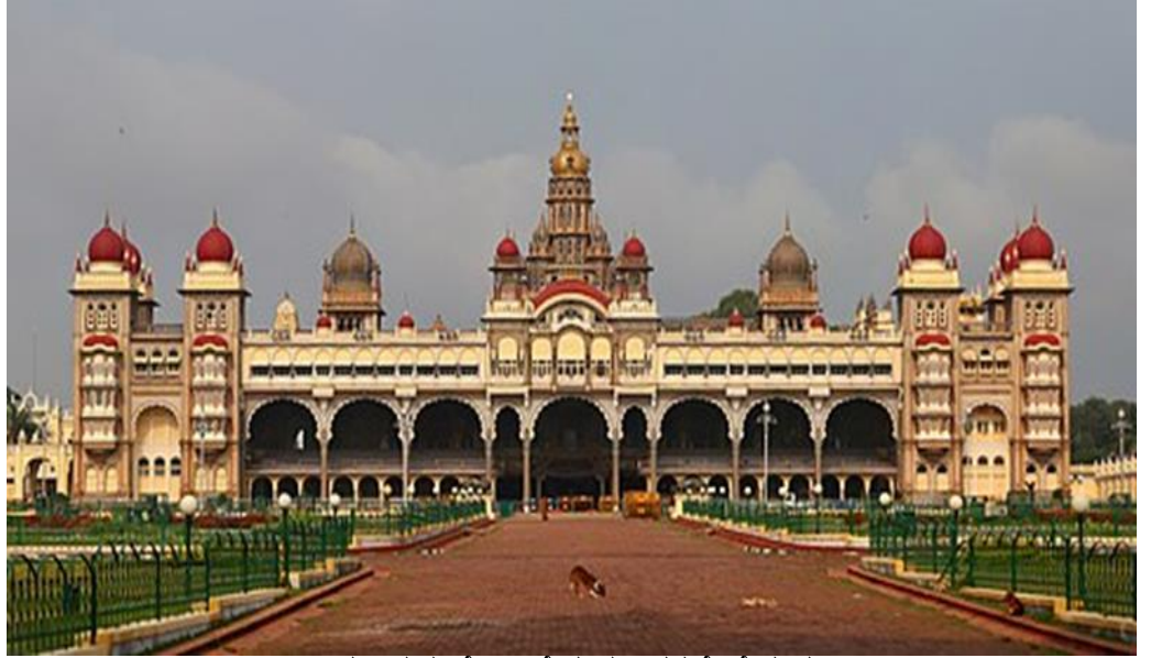
ಭಾಯಾಚಿತ್ರ ಸಂಖ್ಯೆ 1.1: ಮೈಸೂರು ಅರಮನೆ, ಮೈಸೂರು

ಪುರಾತತ್ವ ನಿವೇಶನಗಳು ದೀರ್ಘ ಕಾಲದಿಂದ ಸ್ಮಾರಕಗಳ ಭಾಗವಾಗಿರುತ್ತವೆ ಹಾಗೂ ಅವುಗಳ ಪ್ರದರ್ಶನವು ಗಮನಾರ್ಹ ಪ್ರವಾಸೋದ್ಯಮವನ್ನು ಆಕರ್ಷಿಸುತ್ತದೆ. ಹೆಸರಾಂತ ರಾಜಮನೆತನಗಳು ತಮ್ಮ ಅಳಿಸಲಾಗದ ಗುರುತುಗಳನ್ನು ವಾಸ್ತುಶಿಲ್ಪಗಳ ಮೂಲಕ ಬಿಟ್ಟುಹೋಗಿರುವುದಾದ್ದರಿಂದ ಕರ್ನಾಟಕ ರಾಜ್ಯವು ಒಂದು ಸಂಪದ್ಧರಿತ ಹಾಗೂ ವೈವಿಧ್ಯತೆಯಿಂದ ಕೂಡಿದಂತಹ ಸ್ಮಾರಕಗಳನ್ನು ಹೊಂದಿರುವುದು. ಈ ರೀತಿಯಾಗಿ ಐತಿಹಾಸಿಕ ಸ್ಮಾರಕಗಳು ಮತ್ತು ಪ್ರಾಚೀನಾವಶೇಷಗಳ ಸಂರಕ್ಷಣೆ ಹಾಗೂ ಸುರಕ್ಷತೆಯು ಅತ್ಯಂತ ಪ್ರಮುಖ ವಿಷಯವಾಗಿರುತ್ತದೆ.