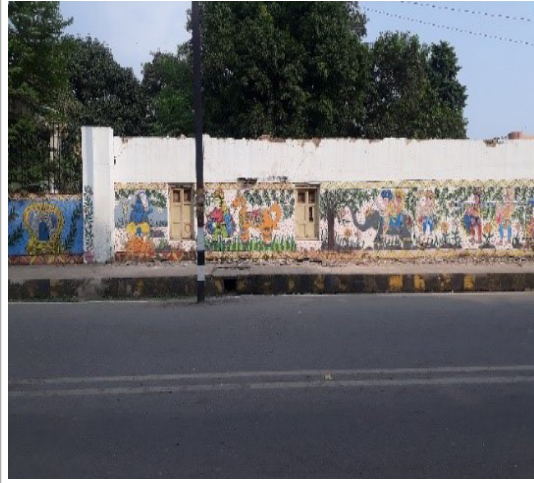
चित्र 1 : पटना पुराने संग्रहालय, पटना की चारदीवारी पर किया गया मधुबनी पेंटिंग का कार्य (नवम्बर 2023)।

संयुक्त भौतिक सत्यापन के दौरान, पटना पुराने संग्रहालय एवं पटना नगर निगम के कार्यालय की चारदीवारी पर की गई पेंटिंग की ली गई चित्रों को, चित्र 1 एवं 2 में दर्शाया गया है।