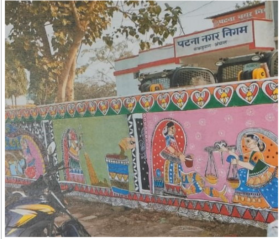
चित्र 2 : नगर निगम, पटना की चारदीवारी पर किया गया मधुबनी पेंटिंग का कार्य (नवम्बर 2023)।

स्मार्ट सिटी मिशन दिशानिर्देश के कार्यक्षेत्र से बाहर, एक परियोजना का क्रियान्वयन करने के परिणामस्वरूप, ₹ 12.36 करोड़ के अनियमित व्यय के साथ ही, मिशन निधियों का विचलन हुआ।