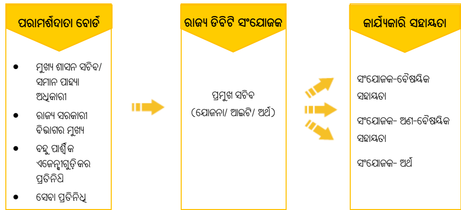
ଚାର୍ଚ୍ଚ 1.1: ଡିଭିଟି ସଂରଚନାରେ ରାଜ୍ୟ ସ୍ତରୀୟ ସଂଗଠନ

ଯୋଜନା ଗୁଡ଼ିକର କାର୍ଯ୍ୟାନୁଷ୍ଠାନ ସହିତ ଜଡ଼ିତ ଜ୍ଞାନକୌଶଳ ପ୍ରାପ୍ତି ଏବଂ ଡିଭିଟି ଅନ୍ତର୍ଗତ ସମସ୍ତ ପ୍ରୟାସର ସମନ୍ୱୟ ପାଇଁ ରାଜ୍ୟ ଡିଭିଟି ସେଲ୍ ଏକ ମାତ୍ର ସଂସ୍ଥା ଭାବରେ କାର୍ଯ୍ୟ କରେ । କେନ୍ଦ୍ର ସରକାରଙ୍କ ନିର୍ଦ୍ଦେଶାବଳୀ ଅନୁଯାୟୀ, ଜୁନ୍ 2018 ରେ ଗୋଟିଏ ରାଜ୍ୟ ଡିଭିଟି ପୋର୍ଟାଲର ଉନ୍ମୋଚନ ହୋଇଥିଲା ଯାହା ରାଜ୍ୟ ସ୍ତରରୁ ଗ୍ରାମ ପସ୍ତାୟତ (ଜିପି) ସ୍ତର ପର୍ଯ୍ୟନ୍ତ ଚାଲିଥିବା ଯୋଜନା ପାଇଁ ଡିଭିଟିର ଅସଙ୍ଗଠିତ ତଥ୍ୟର ପ୍ରଦର୍ଶନ ପାଇଁ ଏକ ତ୍ୟାସ୍ ବୋର୍ଡ ଭାବରେ କାର୍ଯ୍ୟ କରିଥାଏ । ଅଧିକତ୍ତ୍ୱ, ରାଜ୍ୟର ଡିଭିଟି ପୋର୍ଟାଲ, ଜାତୀୟ ଡିଭିଟି ପୋର୍ଟାଲ, ପବ୍ଲିକ ଫାଇନାନ୍ସିଆଲ ମ୍ୟାନେଜମେଣ୍ଟ ସିଷ୍ଟମ (ପିଏଫ୍ଏମ୍ଏସ୍ 2 ), ରାଜ୍ୟ କାର୍ଯ୍ୟକାରୀ ଏଜେନ୍ଦା 3 ପୋର୍ଟାଲ ଏବଂ ରାଜ୍ୟ ଟ୍ରେଜରୀର ଇଣ୍ଟିଗ୍ରେଟେଡ୍ ଫାଇନାନ୍ସିଆଲ ମ୍ୟାନେଜମେଣ୍ଟ ସିଷ୍ଟମ (ଆଇଏଫ୍ଏମ୍ଏସ୍ 4 ) ସହିତ ସଂଯୋଗ ହେବା ଆବଶ୍ୟକ ।