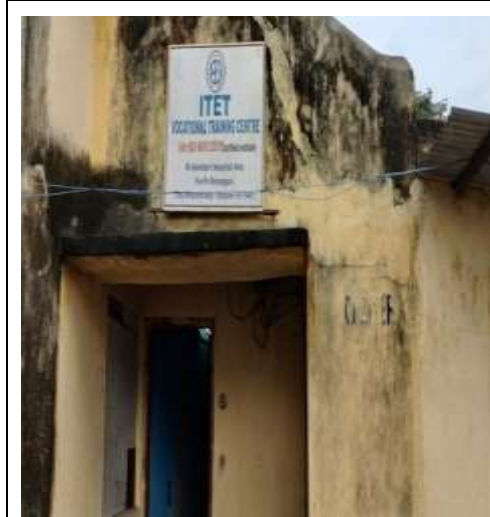
ଆଇଟିଇଟି ଧର୍ମାତ୍ମକ ଚାଲିମ କେନ୍ଦ୍ରର ପ୍ରତିଷ୍ଠାନ କୋଠା