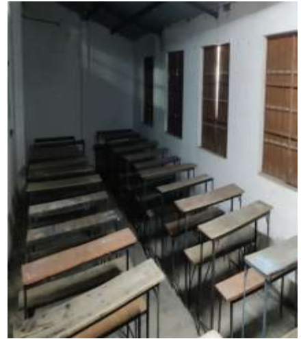
ଆଡମିଶନ ହୋଇଥିବା 792 ଛାତ୍ରାଛାତ୍ରୀଙ୍କ ପାଇଁ 60 ଷମତା ବିଶିଷ୍ଟ କେବଳ ଗୋଟିଏ ଶ୍ରେଣୀ ଗୃହ

ଡିଡବ୍ଲ୍ୟୁଓ, ମୟୂରଭଞ୍ଜ ଦ୍ଵାରା ସୂଚୀତ ହେବା ପରେ ଏବଂ ଏସ୍ଡିଟିଇ ଦ୍ଵାରା ସ୍ଵୀକାରଣ ମଗାଯିବା ପରେ ନଭେମ୍ବର 2019 ରେ ଏସ୍ଏସ୍ଡି ବିଭାଗ ସାକାର କରିଥିଲା, (କ) ବିଏସ୍ଏସ୍ ଏବଂ ଏନ୍ସିଆରଟି ସହବନ୍ଧିତ ଏକେନୁ ଭାବରେ ପ୍ରାୟକୃତ ନୁହନ୍ତି ଏବଂ (ଖ) ତେଣୁ ସହବନ୍ଧିତ ଅନୁଷ୍ଠାନଗୁଡ଼ିକ ପ୍ରେରଣାରେ ପିଏମ୍ଏସ୍ ପାଇଁ ପଞ୍ଜିକରଣ ଯୋଗ୍ୟ ନୁହନ୍ତି । ଏହା ସୂଚାଇ ଦେଇଛି ଯେ ପିଏମ୍ଏସ୍ ଅନୁଦାନ ପାଇଁ ପ୍ରେରଣାରେ ଏହି ଅନୁଷ୍ଠାନଗୁଡ଼ିକ ପଞ୍ଜିକରଣ କରିବା ପୂର୍ବରୁ ଯାଞ୍ଚ ପ୍ରକ୍ରିୟା ସମୟରେ ଯଥାର୍ଥ ତପ୍ତରତା ଦେଖାଇ ପାରିନଥିଲା । ଅଯୋଗ୍ୟ ଅନୁଷ୍ଠାନଗୁଡ଼ିକୁ ଚିହ୍ନଟ ଏବଂ ଅଲଗା କରିବା ପାଇଁ ପ୍ରେରଣା ସଫ୍ଟୱେୟାର ମଧ୍ୟ ସଠିକ୍ ଭାବରେ ସକ୍ଷମ ହୋଇନଥିଲା । ଫଳସ୍ଵରୂପ 15.79 କୋଟି ଟଙ୍କାର ପିଏମ୍ଏସ୍ ବିଦ୍ୟମାନ/ ଅଯୋଗ୍ୟ ଅନୁଷ୍ଠାନ ଦ୍ଵାରା ବ୍ୟୟ ହୋଇଥିଲା ।