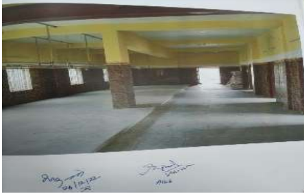
விளக்கப்படம் 4.3: ஈரோடு மாநகராட்சியில் இறைச்சிக் கூடம் கட்டும் பணி

ஒரு எடுத்துக்காட்டு நேர்வு கீழே விவரிக்கப்பட்டுள்ளது: