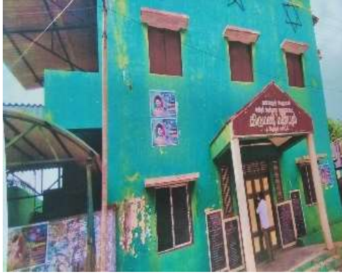
விளக்கப்படம் 4.2: வளவனூர் பேரூராட்சியிலுள்ள சமூகக் கூடம்

ஒரு எடுத்துக்காட்டு நேர்வு கீழே விவரிக்கப்பட்டுள்ளது: