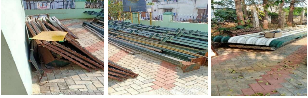
விளக்கப்படம் 4.4: கட்டப்பட்ட வள மீட்பு மையம் தகர்ப்பு

இது தொடர்பாக, தணிக்கை பின்வருவனவற்றைக் கண்டறிந்தது: