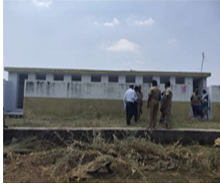
விளக்கப்படம் 4.1: திசையன்விளை பேரூராட்சியிலுள்ள சமூகக் கழிப்பறைகள்

ஒரு எடுத்துக்காட்டு நேர்வு கீழே விவரிக்கப்பட்டுள்ளது: