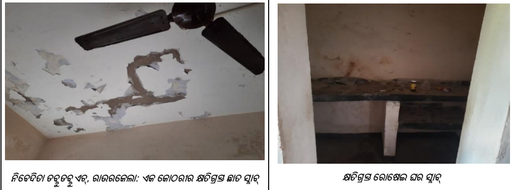
ନିବେଦିତା ତରୁତରୁ ଏର୍, ରାଉରକେଲା: ଏକ କୋଠରୀର କ୍ଷତିଗ୍ରସ୍ତ ଛାତ ସ୍ୱାଚ୍