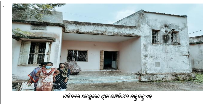
ପରିତ୍ୟକ୍ତ ଅବସ୍ଥାରେ ଥିବା ଭଞ୍ଜବିହାର ତରୁତରୁ ଏର୍

ଏହିପରି, ଉପରୋକ୍ତ ମାମଲାଗୁଡ଼ିକରୁ ଦେଖାଗଲା ଯେ, ସଂପୂର୍ଣ୍ଣ ଆଇଏ ମାନଙ୍କ ଦ୍ୱାରା ପର୍ଯ୍ୟାୟକ୍ରମେ ରକ୍ଷଣାବେକ୍ଷଣ ଅଭାବରୁ ରାଜ୍ୟର ଅଧିକାଂଶ ତରୁତରୁ ଏର୍, ଗୁଡ଼ିକ ଠିକ୍ ଭାବରେ ରକ୍ଷଣାବେକ୍ଷଣ କରାଯାଉନାହିଁ, ଯେଉଁମାନେ ପର୍ଯ୍ୟାପ୍ତ ଅର୍ଥର ଅଭାବକୁ ଏହାର କାରଣ ଦର୍ଶାଉଥିଲେ । କୋଠାର ଅସ୍ୱାସ୍ଥ୍ୟକର ଏବଂ ନୀର୍ଭୀକ୍ଷଣ ଅବସ୍ଥା ତରୁତରୁ ଏର୍ ଗୁଡ଼ିକରେ କମ୍ କ୍ଷମତା ପାଇଁ ଏକ ପ୍ରମୁଖ କାରଣ ହୋଇପାରେ । ଏହି ତରୁତରୁ ଏର୍ ଗୁଡ଼ିକର ଅବସ୍ଥା ସରକାରଙ୍କ ଅଭାବନୀୟ ମନୋଭାବକୁ ଦର୍ଶାଏ, ଯେଉଁଥିପାଇଁ ଏଗୁଡ଼ିକ କାର୍ଯ୍ୟକାରୀ ମହିଳାମାନଙ୍କୁ ଏକ ସଜ୍ଜ, ଆଧୁନିକ ଏବଂ ସଜ୍ଜ ରହିବା ସୁବିଧା ଯୋଗାଇବାରେ ଅସମର୍ଥ ହୋଇଥିଲା । ଏଥିସହ ସଂପୂର୍ଣ୍ଣ ଜିଲ୍ଲାର ଡିଏସ୍‌ଡିଏଓ ମାନଙ୍କ ଦ୍ୱାରା ଯାଞ୍ଚ ଏବଂ ପର୍ଯ୍ୟାଲୋଚନାର ଅଭାବ ମଧ୍ୟ ରହିଥିଲା । ଡିଏସ୍‌ଡିଏଓ ମାନେ ତରୁତରୁ ଏର୍ ଗୁଡ଼ିକର ପରିଚାଳନାରେ ଅଂଶଗ୍ରହଣ କରିନଥିଲେ, ଯଦିଓ ସେମାନେ ହଠାତ୍ ପରିଚାଳନା କମିଟିର ଅନ୍ୟତମ ସଦସ୍ୟ ଥିଲେ ।