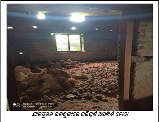
ଯାଜପୁରର ଉଇହୁଙ୍କାରେ ପରିପୂର୍ଣ୍ଣ ଅବସ୍ଥିତ କୋଠା