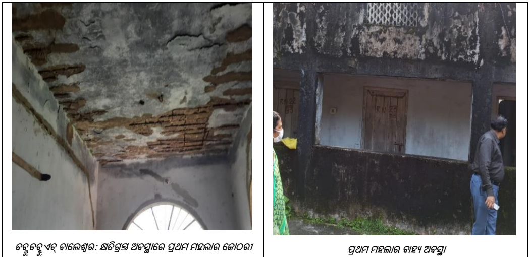
ଡକ୍ଟରୁ ଏର୍ ବାଲେଶ୍ଵର: କ୍ଷତିଗ୍ରସ୍ତ ଅବସ୍ଥାରେ ପ୍ରଥମ ମହଲା କୋଠରୀ