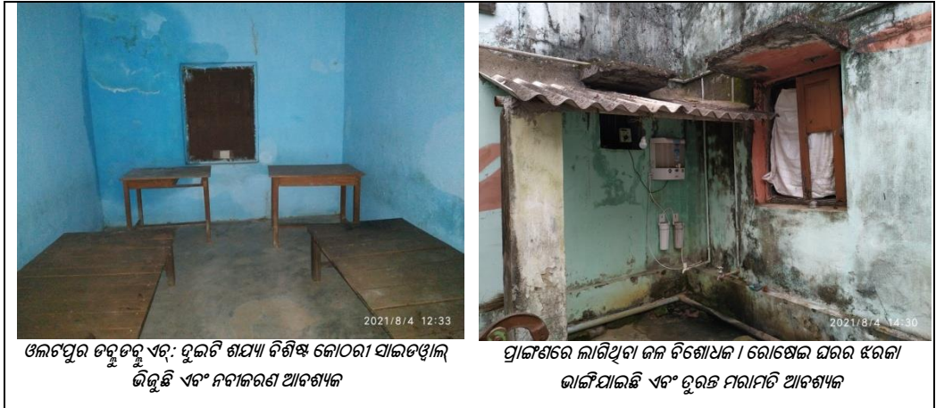
ଓଲଟପୁର ଡକ୍ଟରୁ ଏର୍: ଦୁଇଟି ଶଯ୍ୟା ବିଶିଷ୍ଟ କୋଠରୀ ସାଇଡ଼ଓଲ ଜିଲ୍ଲା ଏବଂ ନବୀକରଣ ଆବଶ୍ୟକ

ହୋଇଥିଲେ ମଧ୍ୟ 2016-21 ମଧ୍ୟରେ ହାରାହାରି ଦଖଲ ହାର କେବଳ 77 ପ୍ରତିଶତ ଥିଲା । ଏଥିରେ ଦର୍ଶାଯାଇଥିଲା ଯେ ମରାମତି ତଥା ରକ୍ଷଣାବେକ୍ଷଣ କାର୍ଯ୍ୟ କରିବା ପାଇଁ ସଂଗୃହୀତ ଭଡ଼ା ପର୍ଯ୍ୟାପ୍ତ ନଥିଲା ଏବଂ ଡକ୍ଟରୁ ଏର୍ ରକ୍ଷଣାବେକ୍ଷଣ ଦାୟିତ୍ଵରେ ଥିବା ଏନ୍‌ଜିଓର ସମ୍ପାଦକ ବିଲ୍ଲିଂର ନବୀକରଣ ପାଇଁ ଅତିରିକ୍ତ ପାଣ୍ଠି ଚାହୁଁଥିଲେ ।