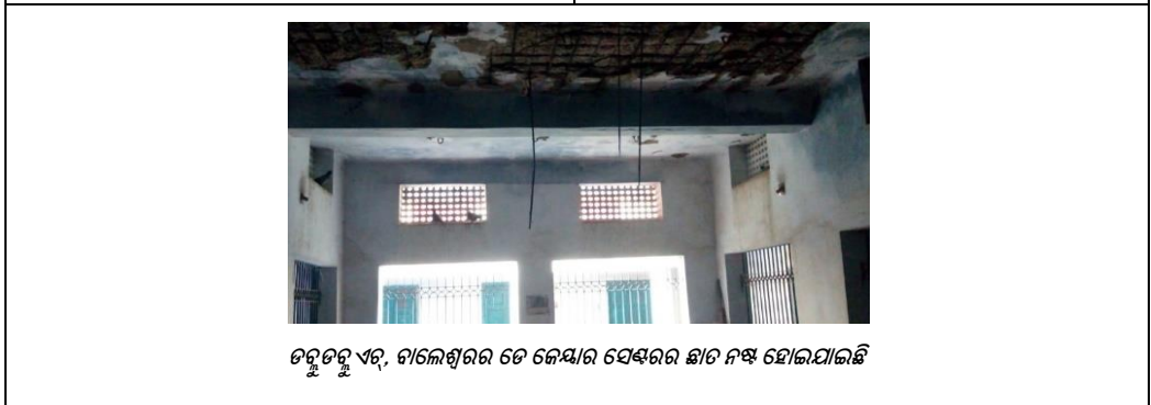
ଡକ୍ଟରୁ ଏର୍, ବାଲେଶ୍ଵରର ତେ ଜେୟାର ସେକ୍ଟରର ଛାତ ନଷ୍ଟ ହୋଇଯାଇଛି