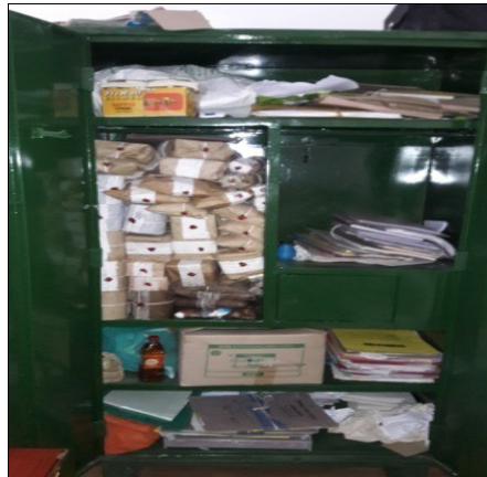
पैराग्राफ-3.1 कांगड़ा जिले में एक अलमारी में रखे गये खाद्य नमूने

मंत्रालय ने तथ्यों को स्वीकार किया (जून 2017)।