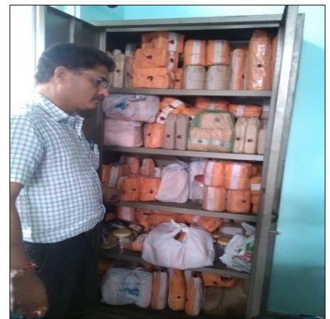
पैराग्राफ -3.2 & 3.3 कामरूप (मेट्रो) जिला में स्टील अलमारी में रखे गए खाद्य नमूने