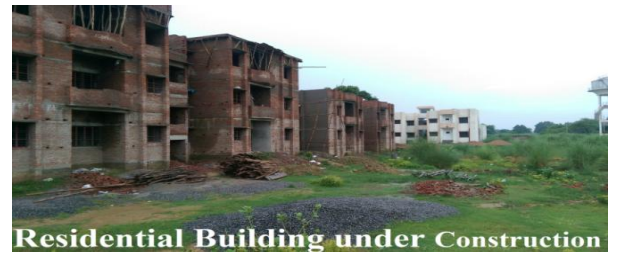
Residential Building under Construction

सभी श्रेणी के आवासों की अत्यधिक कमी थी यद्यपि अपेक्षित आवासों के मूल्यांकन का आधार स्वीकृत मानव शक्ति न होकर वर्तमान में राज्य में कार्यरत मानव शक्ति (स्वीकृत मानव शक्ति का 49 प्रतिशत) थी।