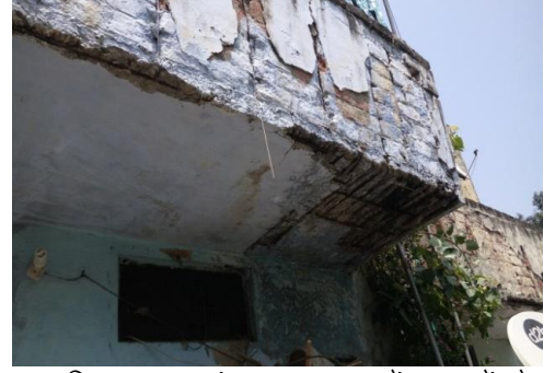
पुलिस थाना कांठ शाहजहापुर में आवासों के जीर्ण होने की स्थिति

उत्तर में शासन ने लेखापरीक्षा आपत्ति पर कोई टिप्पणी नहीं की।