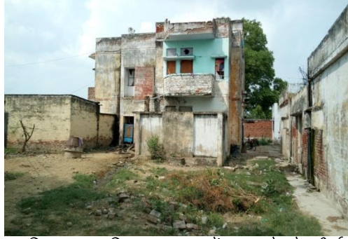
पुलिस थाना बितुर कानपुर में आवासों के जीर्ण होने की स्थिति