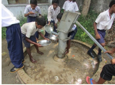
मध्य विद्यालय सेक्टर-4 में मध्याह्न भोजन खाने के बाद थाली धोते बच्चे