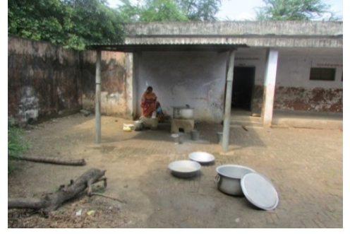
खुला रसोई घर म.वि. सेक्टर-4, सितम्बर 2014

आगे यह भी पाया गया कि सभी नमूना-जाँचित 180 विद्यालयों में से 166 विद्यालयों में खाना खाने की थालियाँ अपर्याप्त थी। 14 विद्यालयों में से मध्याह्न भोजन के लिए थालियों की व्यवस्था खुद बच्चों द्वारा की गई।