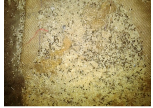
प्राथमिक विद्यालय लोयाबाद, धनबाद-II में चूहे की शौच से सड़े अनाज दिनांक (24.4.15)