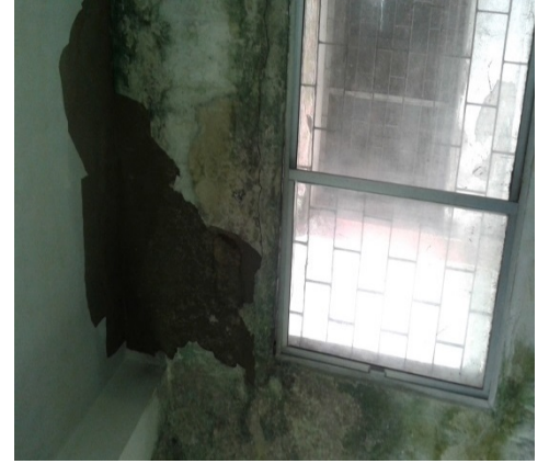
ग्रा.स्वा.प्र.के. भवन, गोविन्दपुर की जीर्ण-शीर्ण स्थिति

सामुदायिक उन्मुख प्राथमिक स्वास्थ्य देखभाल पर व्यावहारिक प्रशिक्षण प्रदान करने के लिए पी.एम.सी.एच., धनबाद के दोनों ग्रा.स्वा.प्र.के. एवं श.स्वा.प्र.के. मानवबल के साथ ही साथ आधारभूत संरचना की कमी के कारण बन्द थे।