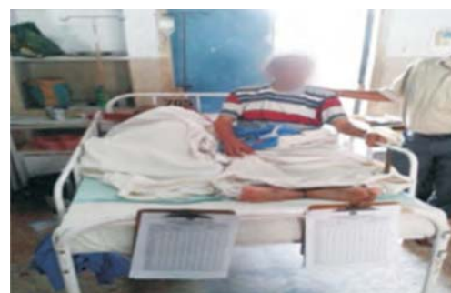
तस्वीर 4.2 एवं 4.3 : क.रा.बी. अस्पताल, जोका, पश्चिम बंगाल