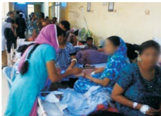
तस्वीर 4.1 : क.रा.बी.नि. अस्पताल, ओखला का प्रसूति वार्ड

4.2.3.2 क.रा.बी. अस्पताल ओखला में भी विभिन्न वार्डों में अंत-मरीज सुविधाओं में कमी आई क्योंकि एक बिस्तर पर 2 या 3 मरीजों को रखा गया था। 2012-13 के दौरान, विभिन्न वार्डों में बिस्तर अधिभोग 61 से 205 प्रतिशत तक था। प्रसूति वार्ड में लेखापरीक्षा ने पाया कि एक बिस्तर पर प्रसूति के कई मामले थे जो कि शिशु एवं माता के स्वास्थ्य के लिए खतरा था।