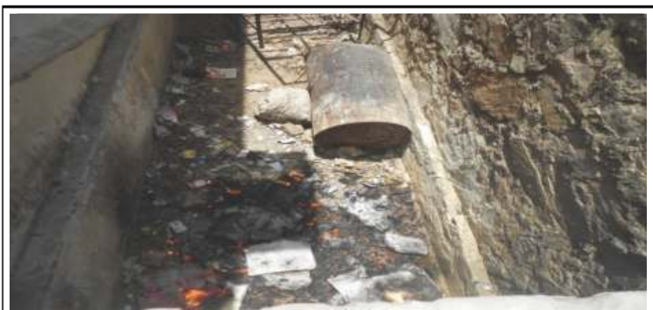
पशु चिकित्सालय, जगतपुरा, जबपुर में बीएमडब्ल्यू को जलाया गया

यह दृष्टिगत हुआ कि 56 एचसीएफ (23 पशु औषधालयों के अलावा) में से वर्ष 2010-11 में 4 एचसीएफ, 2011-12 में 7 एचसीएफ और 2012-13 में 19 एचसीएफ में उनकी स्वयं की उपचार सुविधा नहीं थी और वे सीबीडब्ल्यूटीएफ से भी नहीं जुड़े हुये थे। बीएमडब्ल्यू के उत्सर्जन एवं जिस तरीके से इनका निस्तारण किया जा रहा था, के अभिलेख भी उनके द्वारा संधारित नहीं किये जा रहे थे। इसलिये इन एचसीएफ द्वारा उत्सर्जित किये गये बीएमडब्ल्यू को कैसे निस्तारण किया गया, सुनिश्चित नहीं किया जा सका। सभी 23 पशु औषधालय सीबीडब्ल्यूटीएफ से जुड़े हुये नहीं थे और उत्सर्जित बीएमडब्ल्यू या तो जला दिया गया या खुले गड्ढों में डाल दिया गया था।