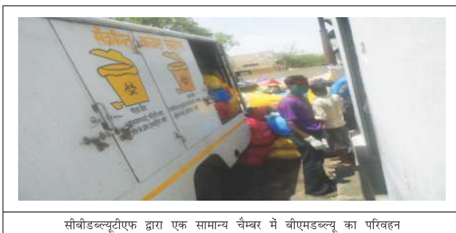
सीबीडब्ल्यूटीएफ द्वारा एक सामान्य चैम्बर में बीएमडब्ल्यू का परिवहन

संयुक्त निरीक्षण (29 मई 2013) के दौरान यह देखा गया कि एसएमएस अस्पताल से सीबीडब्ल्यूटीएफ द्वारा एकत्र बीएमडब्ल्यू अलग रंग के कक्षों में नहीं रखा गया था और दिशा निर्देशों के प्रावधानों का उल्लंघन करते हुए सभी बैगों को एक साथ केबिन में रखा जा रहा था। विवरण, जैसे कि वजन, नहीं लिया जा रहा था और इसकी प्रविष्टियाँ रजिस्टर में केवल अनुमानित आधार पर की जा रही थीं।