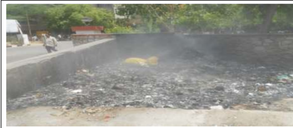
जयपुरिया अस्पताल, ज्वपुर में बायोजेनिक जलाना गवा