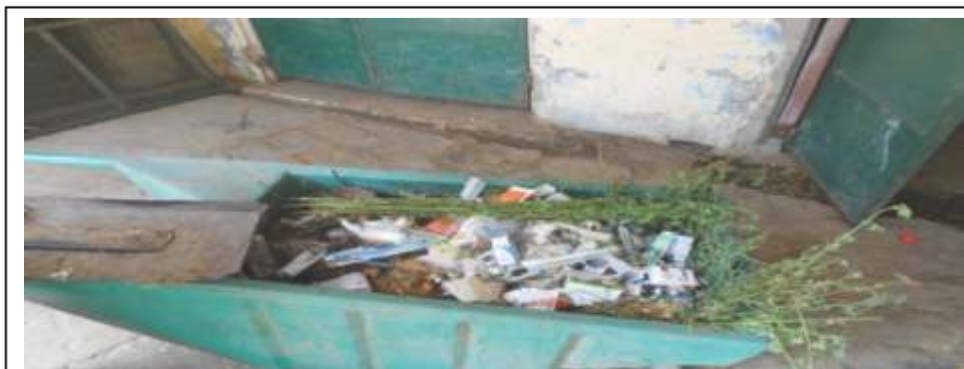
पशु बहुउद्देशीय चिकित्सालय, जयपुर में बीएमडब्ल्यू के आन्तरिक परिवहन के लिये ढँकी हुई ट्रॉली नहीं थी।

25. एसएमएस अस्पताल, मांडिल चिकित्सालय, राजकीय दन्त महाविद्यालय एवं अस्पताल, जयपुरिया अस्पताल, हरि बक्ष कांवटिया अस्पताल एवं बहुउद्देशीय पशु चिकित्सालय