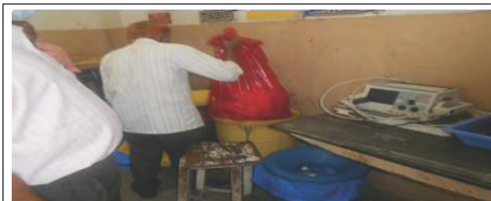
एसएमएस अस्पताल, जयपुर में अपशिष्ट संचालकों के लिये कोई सुरक्षा उपाय नहीं था।

यह प्रेशिंत हुआ कि निरीक्षण किये गये 22 एचसीएफ में किसी ने भी अपशिष्ट संचालकों को ये आइटम उपलब्ध नहीं करवाये। बीएमडब्ल्यू के लिये कोई भण्डारण कक्ष उपलब्ध नहीं कराया तथा बहुउद्देशीय पशु चिकित्सालय में बीएमडब्ल्यू थैलियों को खुले मैदान में रखा गया। हरिबक्ष कांवटिया अस्पताल, जयपुरिया अस्पताल और राजकीय दन्त महाविद्यालय एवं अस्पताल में भण्डारण कक्ष से तरल अपशिष्ट खुले मैदान में बाहर आ रहा था, जो जमीन में रिसाव हो कर भूजल को दूषित कर रहा था। 6 एचसीएफ में बीएमडब्ल्यू के आन्तरिक परिवहन के लिये कोई ढँकी हुई ट्रॉलियों उपलब्ध नहीं करवायी गई थी।