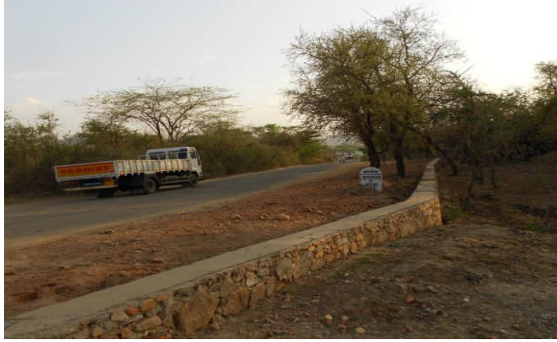
सरिस्का वन्यजीव अभ्यारण्य के अन्दर राज्य उच्च मार्ग-13 पर यातायात

राउ-13 के वैकल्पिक रोड़ बनाने के लिए सार्वजनिक निर्माण विभाग द्वारा तैयार किये गये आंकलन के आधार पर वन विभाग द्वारा ₹ 21.11 करोड़ का एक प्रस्ताव राष्ट्रीय बाघ संरक्षण प्राधिकरण (राबासंप्रा) को भेजा गया (अगस्त 2011) जिसे 2012-13 तक पूर्ण किया जाना था। तथापि राबासंप्रा ने राज्य सरकार को निर्देश दिये (नवम्बर 2011) कि परियोजना की स्वीकृति से पूर्व, प्रथमतः यह सुनिश्चित किया जाये कि राउ-29ए भारी यातायात के लिये पूर्णतः बन्द कर दिया गया है। तथापि उवसं, बाघ परियोजना सरिस्का की लेखापरीक्षा में प्रेक्षित हुआ कि दो वर्ष से अधिक का समय व्यतीत हो जाने पर भी राउ-13 पर भारी वाहन एवं राउ-29ए पर तीन नियमित बसें अभी तक संचालित हो रही हैं (मार्च 2012)।