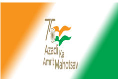
Azadi.jpg 60 KB